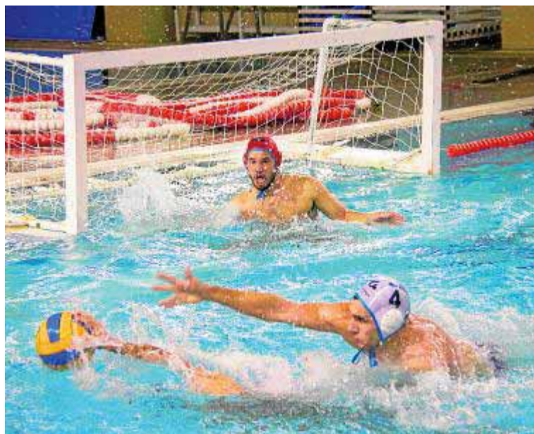
El Inacua Balcón del Genil inicia la competición.

Para ello contará este año con su filial, que repite en Segunda Andaluza y que también arranca esta tarde en casa (17.45 horas) el curso contra el Ronda. En esta categoría también aparece el CW Motril, cuyo estreno se demorará hasta el próximo 21 de noviembre.