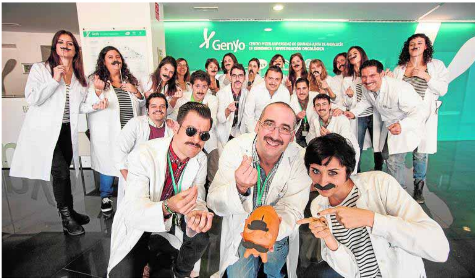
Investigadores granadinos arrancaron ayer una campaña para captar fondos y concienciar sobre los tumores de próstata.