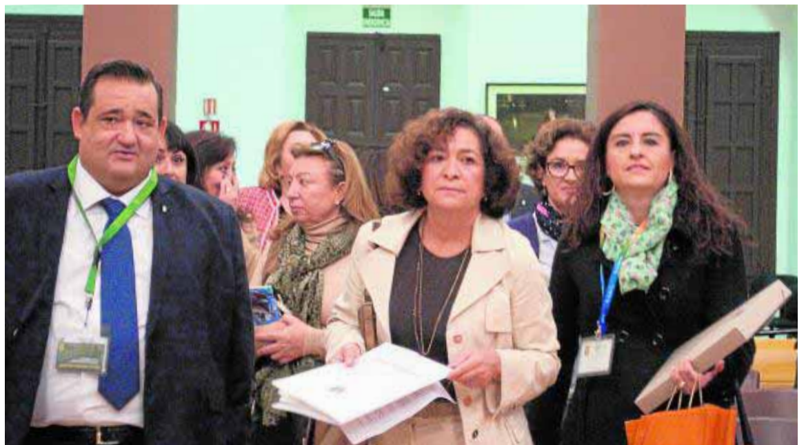
La rectora (c), en la jornada inaugural.

Las jornadas, que concluyen hoy, llevan por lema 'Innovación, Profesión y Futuro'. En las ponencias se están abordando temas muy variados y se ha hecho especial hincapié en las Tecnologías de la Información y la Comunicación y su papel en las bibliotecas. «El lema expresa las inquietudes y la temática que se tratan en la