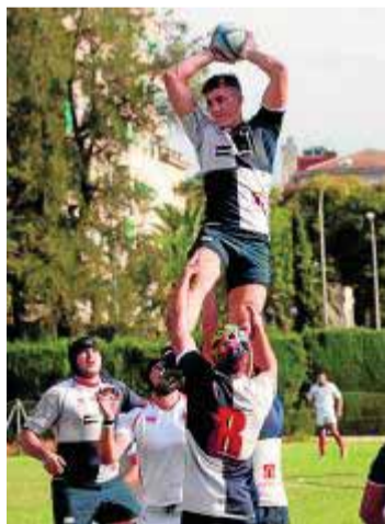
'Touche' del 'Uni'. :: J. J. M.

El 'hambre' de los universitarios es tal que ya no importa la entidad del adversario que se tenga enfrente. En esta ocasión, los hombres de Manolo Conde actuarán como visitantes en el feudo de Las Rozas (16 horas) para luchar contra Industriales. Los madrileños han sacado adelante la mitad de sus compromisos (balance 3-3) gracias, entre otros aspectos, a su solidez como locales. De su campo