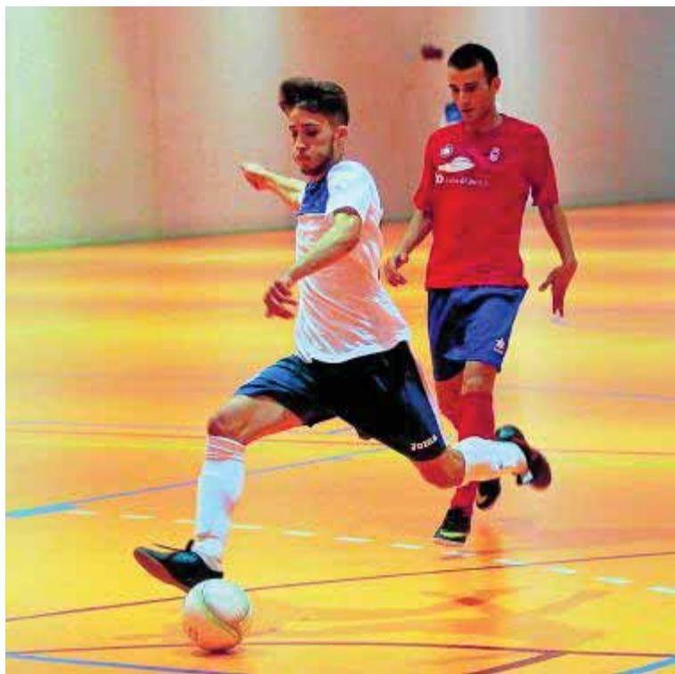
Ataque del Peligros en su partido contra el Mengíbar.

En el caso de doblegar a los extremeños, la entidad metropolitana podría abrir una brecha importante con los equipos de abajo y ese es el deseo de los granadinos. Para este duelo apunta nuevamente a baja Gonzalo, quien todavía no se ha recuperado por completo de las molestias físicas que le han apartado de las canchas durante las últimas semanas. Si se confirma esta ausen-