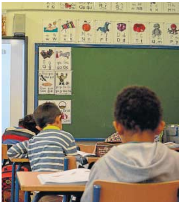
Alumnos de otros países.