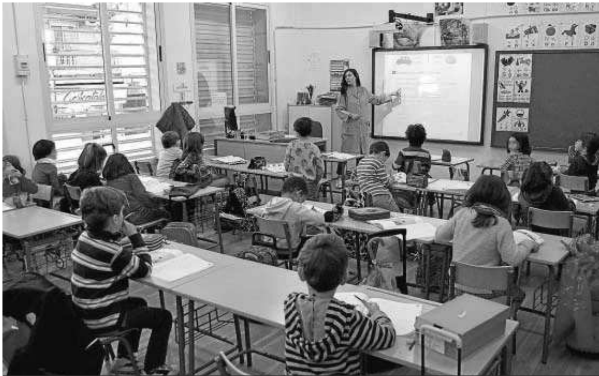
Clase de Infantil del CEIP José Hurtado.