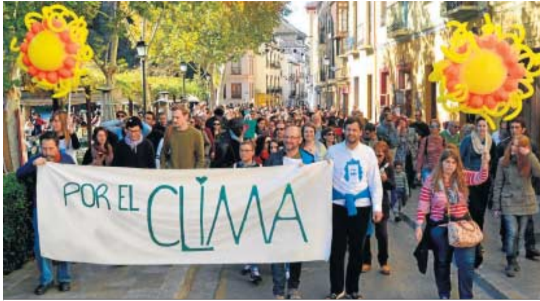
Decenas de personas participaron en la marcha pedestre que partió desde el Paseo de Salón.

El Paseo de los Tristes acogió un ecomercado, una exhibición de vehículos sostenibles y actividades para los más pequeños. Ca-