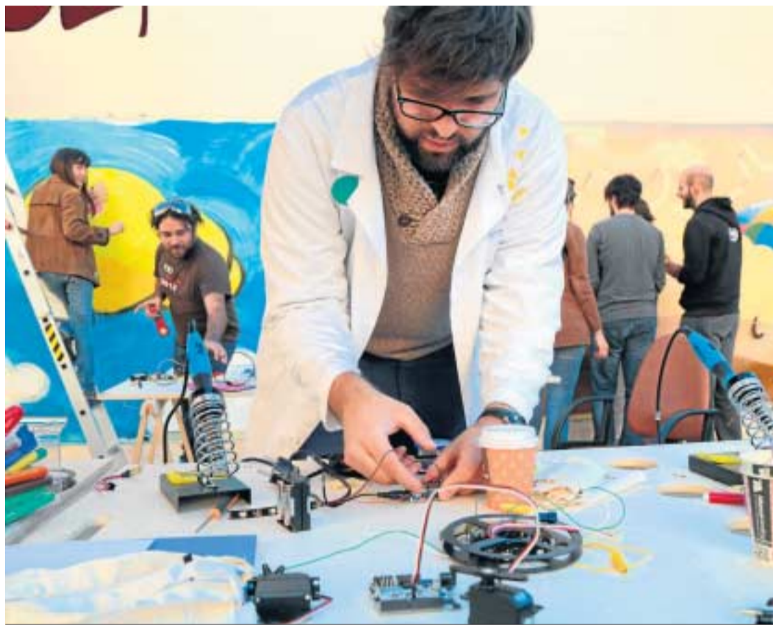
El equipo de Circolabo ofreció a los grafiteros la posibilidad de recrear sus creaciones con cortadoras láser.