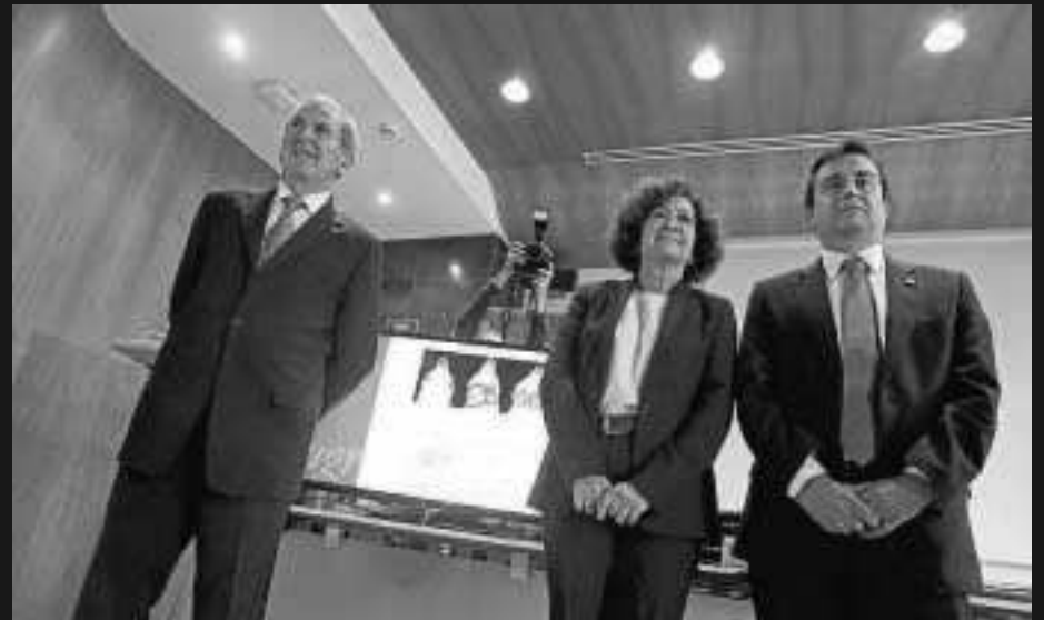
PATENTE. La Universidad ha patentado este posible fármaco. Desde su presentación pública por parte de los científicos y la rectora la noticia ha corrido por el mundo entero como una esperanza.