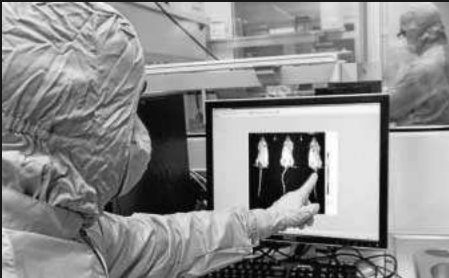
RESULTADOS. Las pruebas de uno de los cinco componentes patentados son muy esperanzadoras, pues se ha conseguido reducir el tumor un 50% en 41 días de tratamiento.