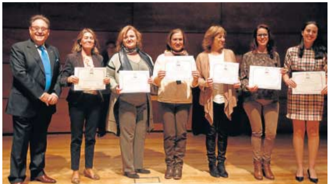
Entrega de diplomas a los voluntarios en el acto celebrado en el Auditorio de Caja Rural.

El proyecto, con un presupuesto cercano a los 35.000 euros obtenidos a través de una campaña de patrocinio y mecenazgo, movilizaría a un equipo de unas quince personas y se iniciaría con la retirada de tierra en la zona hasta llegar al nivel original del terreno, a partir de los estudios estratigráficos efectuados. El objetivo del proyecto planteado no es la exhumación de restos sino dar conclusión al trabajo de investigación ya iniciado y que, en su primera fase, fue impulsado por la anterior Dirección General de Memoria Democrática.