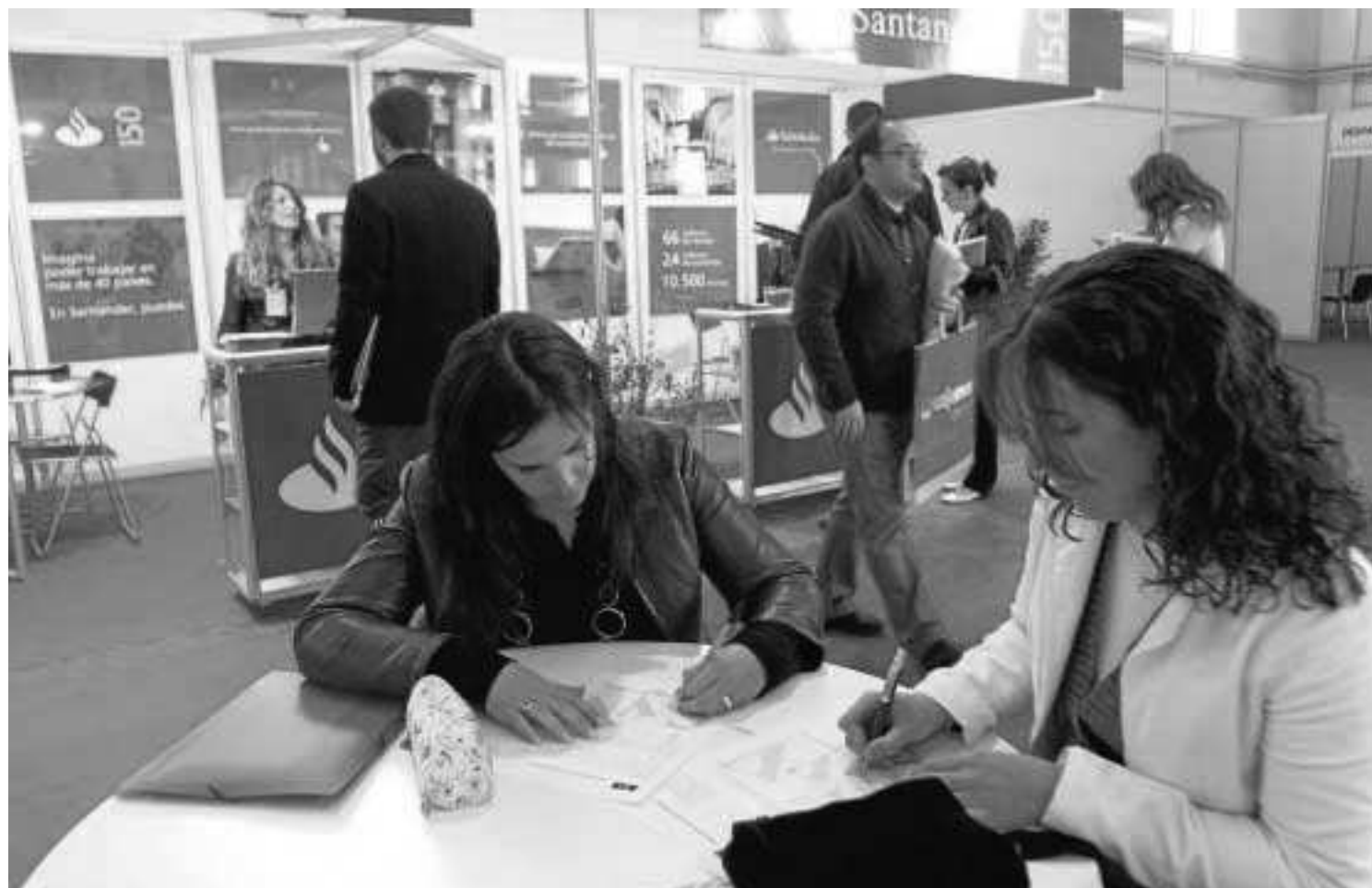
La UGR pretende retomar en próximos años la celebración de la Feria del Empleo que organizaba antes de la crisis.

● El Foro de Empleo conecta el ámbito universitario con el laboral ● Ya se han enviado 3.450 curriculum a las firmas