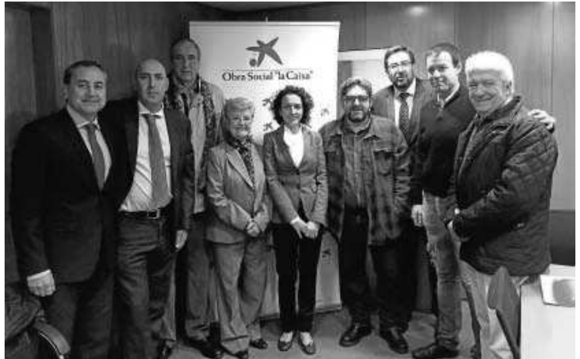
Foto de familia con la presencia de las asociaciones beneficiadas.

Borderline Granada se está trabajando en la formación e inserción laboral de este colectivo. El objetivo del programa será proporcionar a estos jóvenes un servicio de formación, orientación y apoyo, que les permita una incorporación al mercado laboral adaptada a sus capacidades, ayudándoles a marcar el itinerario de inserción laboral específico para su discapacidad. Un total de 60 personas se beneficiarán de este proyecto para el que