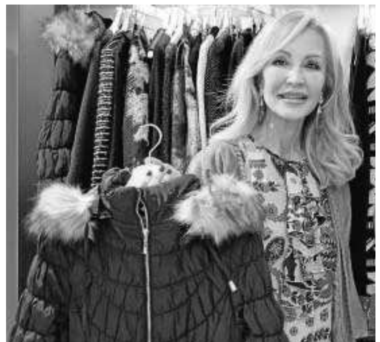
Carmen Lomana visitó ayer la capital para la inauguración de la tienda.

Según detalla, desde que se inauguró la primera tienda en Alicante en otoño de 2010, Top Queens ha llevado una política de expansión rápida y segura que cada semana le permite abrir nuevas tiendas. Su modelo de negocio con un precio único a 25 euros y sus colecciones semanales inspiradas en grandes diseñadores han resultado el éxito absoluto.