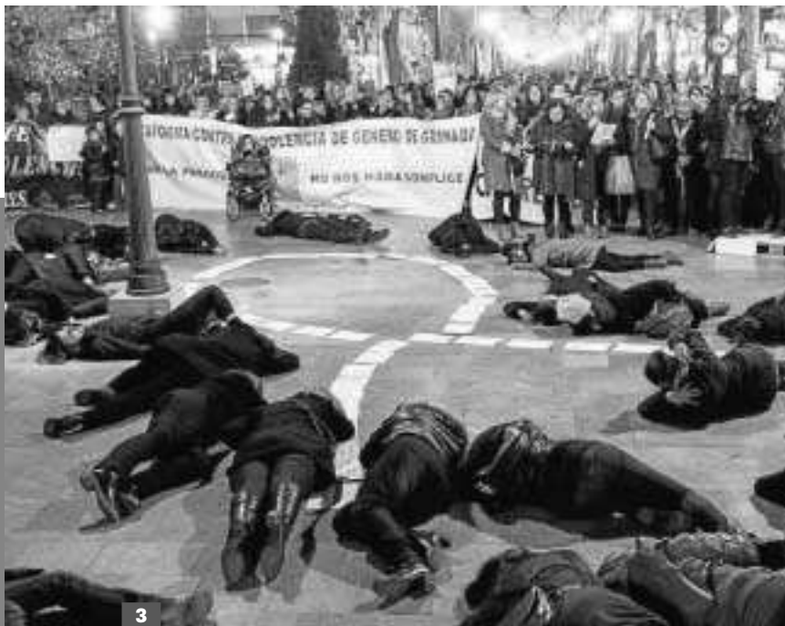
1. Amnistía Internacional llenó ayer la Carrera de la Virgen de zapatos rojos para reclamar una mayor visibilización del feminicidio. 2 y 3. La Plataforma 25-N organizó la performance 'Women in Black' en torno a un lazo blanco que contenía los nombres de las víctimas. 4. La UGR inició ayer la campaña 'Ni un minuto de silencio' con un minuto de ruido. 5 y 6. Cientos de personas participaron en la manifestación.