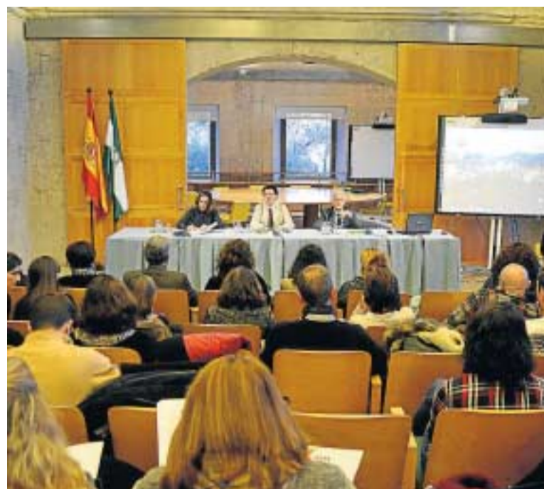
Momento de la presentación ayer del simposio en el Carlos V.

Organizado por la Escuela de la Alhambra y la UNIA, este seminario internacional tiene como objetivo “proporcionar al alumnado una formación avanzada”.