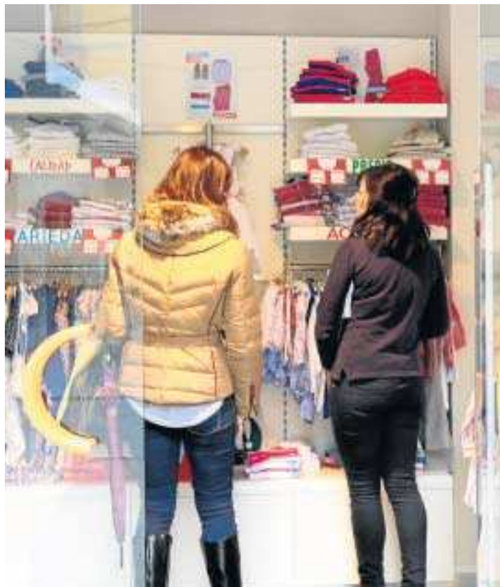
Los comerciantes ven esta fiesta americana como una oportunidad.

Según las estimaciones que baraja el gerente del Centro Comercial Abierto, el 32% de las ventas que se realizaron el pasado año con motivo de la fiesta se correspondieron a adelantos de la campaña de Navidad. Así, las primeras