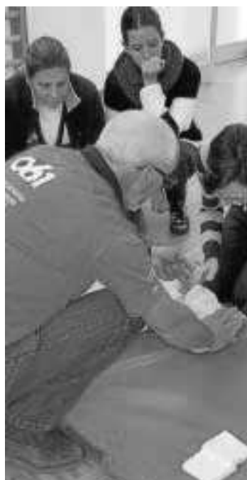
Los profesores durante la formación.

Los profesores del Centro Público de Educación Especial Jean Piaget de Ogijares conocieron, directamente de los profesionales del 061, como aplicar los primeros auxilios y las técnicas básicas de reanimación cardiopulmonar que se deben poner en práctica en situaciones de emergencia sanitaria en las que corre peligro la vida de una persona.