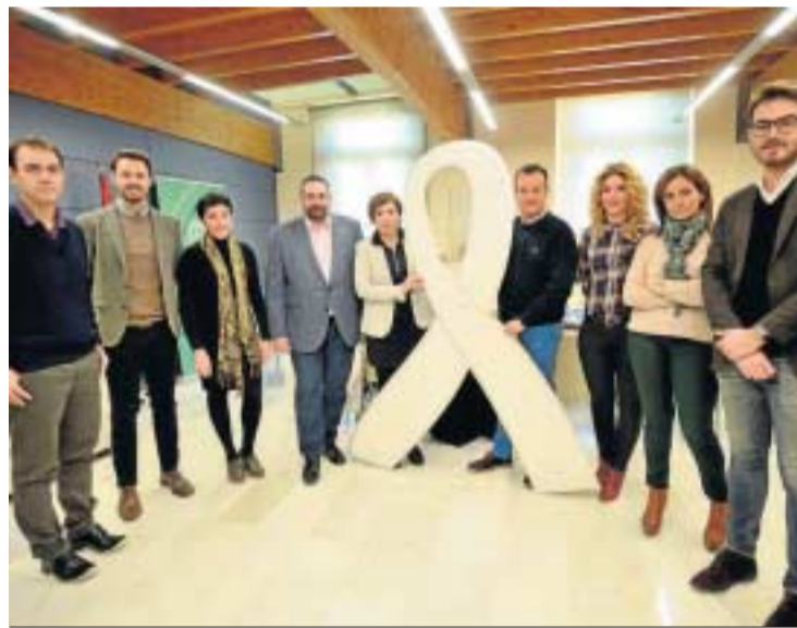
El equipo de delegados mostró ayer su compromiso por el 25-N.

Pero la violencia de género no es cosa de un solo día. Durante la víspera también se celebraron algunos actos que demostraron el compromiso de Granada en la lucha contra una lacra social que se resiste a desaparecer. La reunión de coordinación del equipo de delegados de la Junta de Andalucía, por ejemplo, se centró en buena medida en los mecanismos para luchar contra la