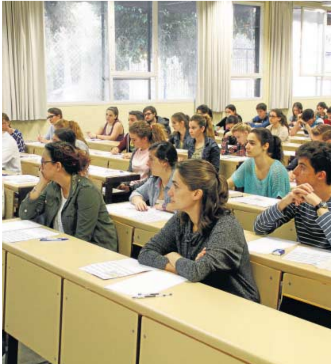
Los alumnos de segundo curso de Bachillerato se preparan para la selectividad.