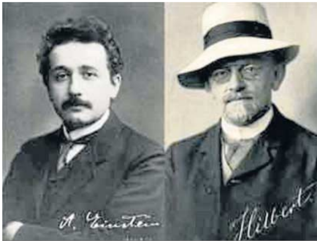
Einstein y Hilbert publicaron la teoría casi al mismo tiempo, aunque la autoría se reconoce al primero. Hilbert era el otro que, según Einstein, la entendía.

Todo esto, que aparentemente tiene poca utilidad para nuestras vidas cotidianas, está más presente en ellas de lo que pensamos. Es cierto que no nos movemos a velocidades tan grandes para notar los