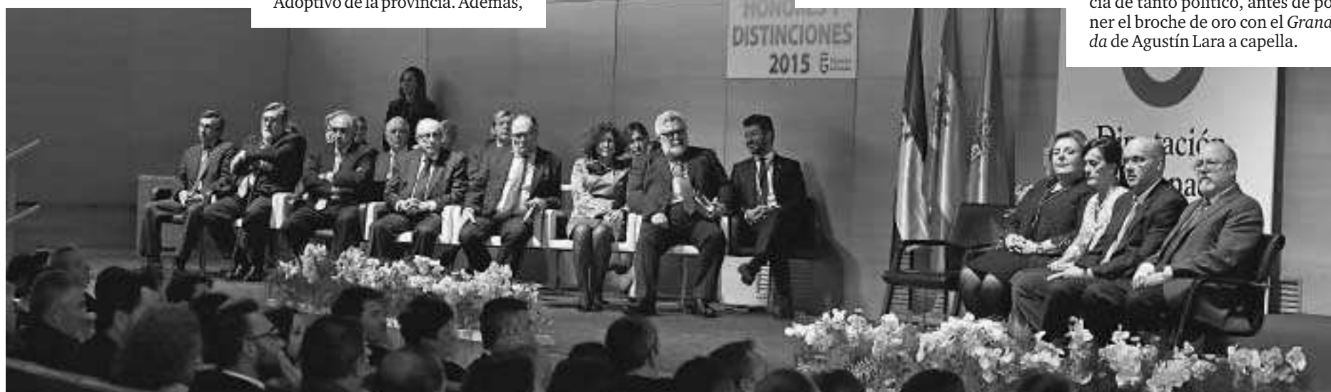
Entrega de los Honores y Distinciones de la provincia en el año 2015, anoche en el salón de actos del Teatro CajaGranada.

Para cerrar el acto, el presidente felicitó a los premiados por “representar la manera que tienen los granadinos de sentir, de vivir y de contribuir al futuro de esta tierra”. Entrena alabó Granada como una provincia que “permanece fiel a sí misma, a su tradición universitaria e intelectual y a su condición de centro cultural, donde se fortalece la convivencia y la diversidad”. Unas palabras que dieron paso a la actuación del Coro de Ópera, cuyo director reivindicó el proyecto del Teatro de la Ópera ante la presencia de tanto político, antes de poner el broche de oro con el Granada de Agustín Lara a capella.