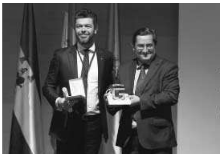
El director de orquesta Pablo Heras-Casado, nombrado Hijo Predilecto.