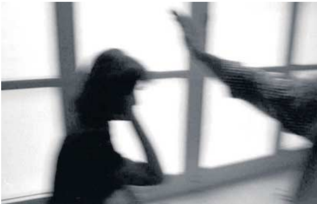
Se sospecha que un 70% de las maltratadas no han dado el paso de denunciar.