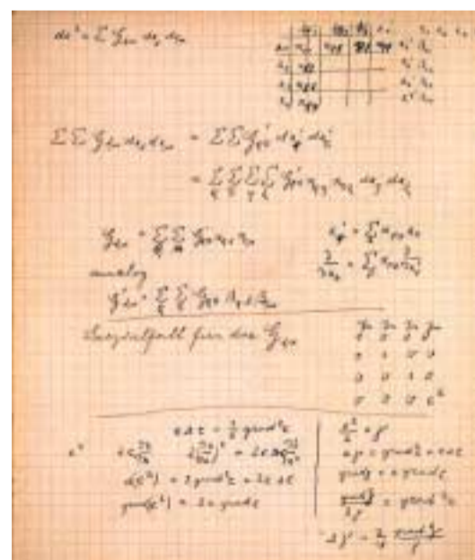
Algunas notas de Einstein de la Teoría General de la Relatividad.

Ambas correcciones son del orden del microsegundo (un microsegundo es la millonésima parte de un segundo), imperceptible pa-