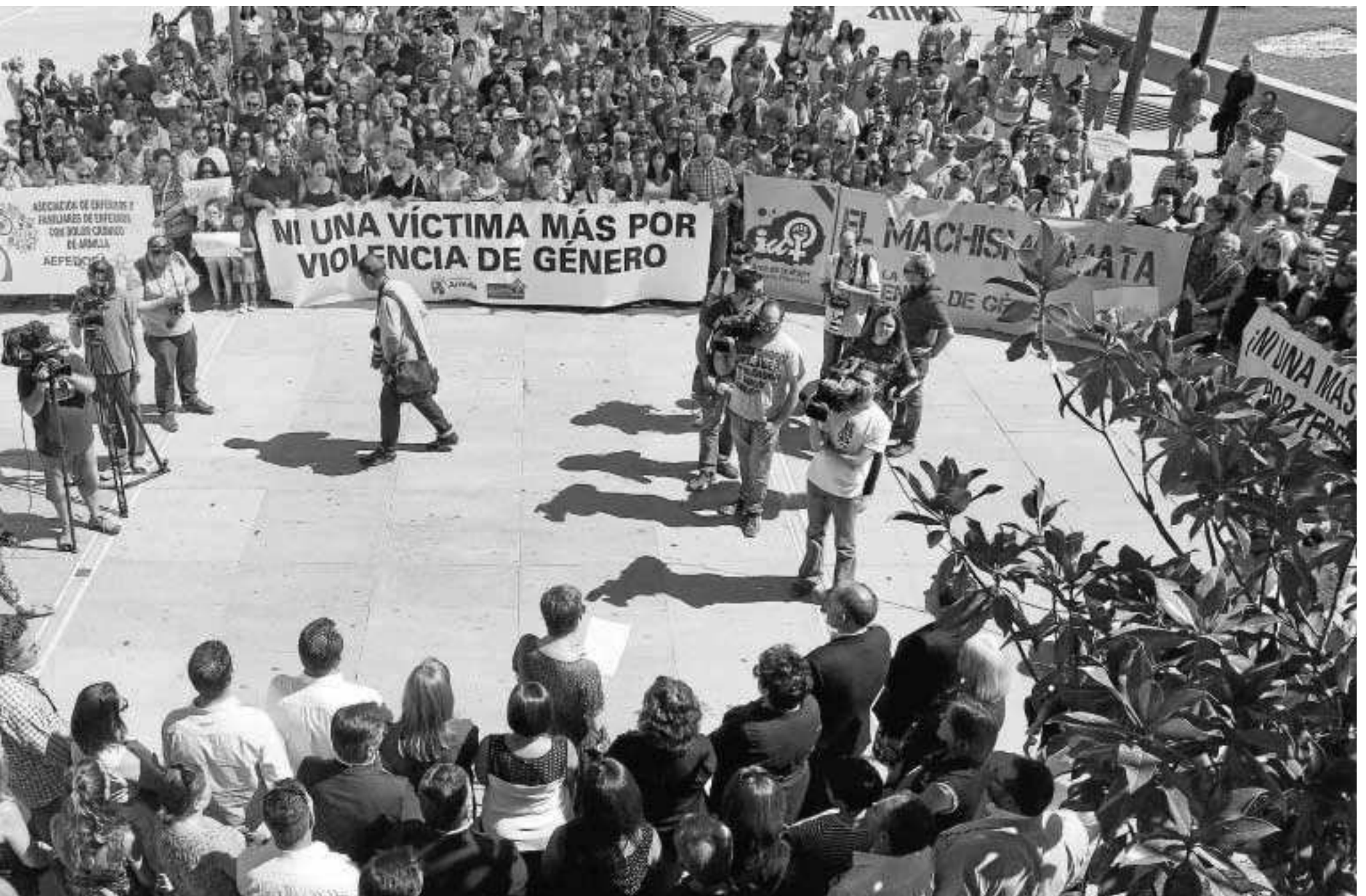
Imagen de la concentración celebrada en Armilla tras el brutal crimen machista de Otilia Márquez, ocurrido este verano.