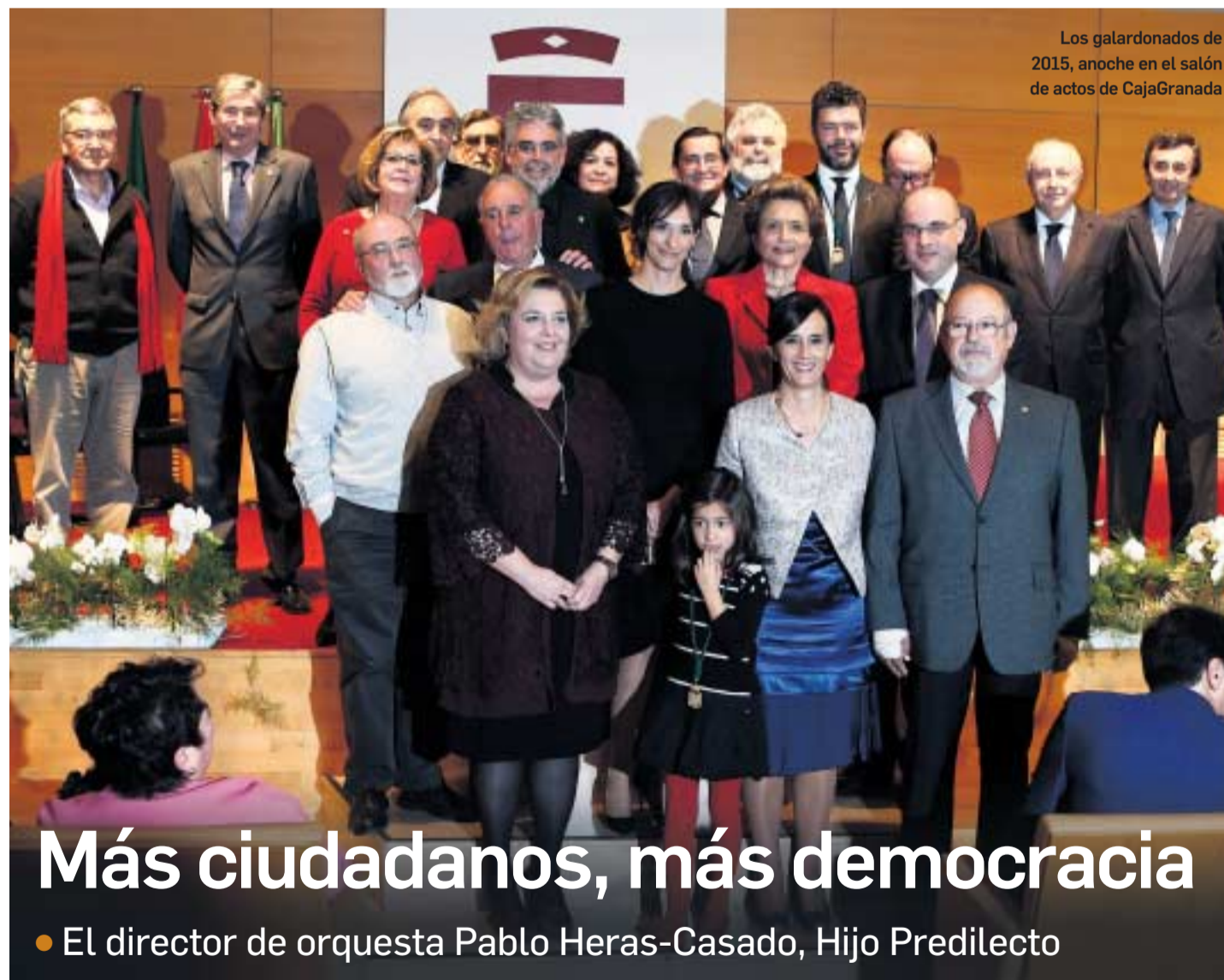
Los galardonados de 2015, anoche en el salón de actos de CajaGranada

17 HONORES Y DISTINCIONES DE LA DIPUTACIÓN