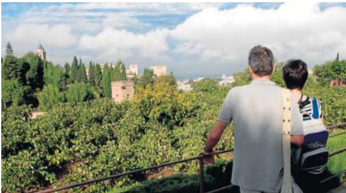
Dos turistas contemplan un cultivo de vid en la conocida como Huerta Grande.