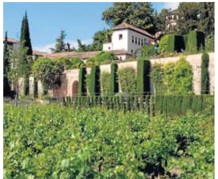
El entorno patrimonial eleva el valor de las Huertas del Generalife.

● El Patronato publica un libro sobre el legado histórico de las Huertas del Generalife ● Es el primer paso para la redacción de un plan general de conservación y gestión