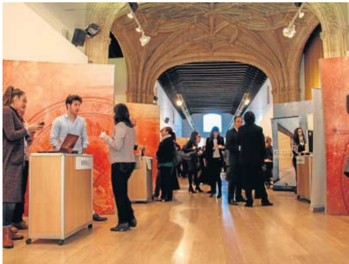
La UGR celebra cada año unas jornadas para abordar la situación de las 'spin off'.

Según informó la propia Universidad, en el continente africano han comenzado su estrategia de internacionalización especialmente las empresas de energías renovables, como Invesia, Agua y Sostenibilidad y Greening, Ingeniería civil y