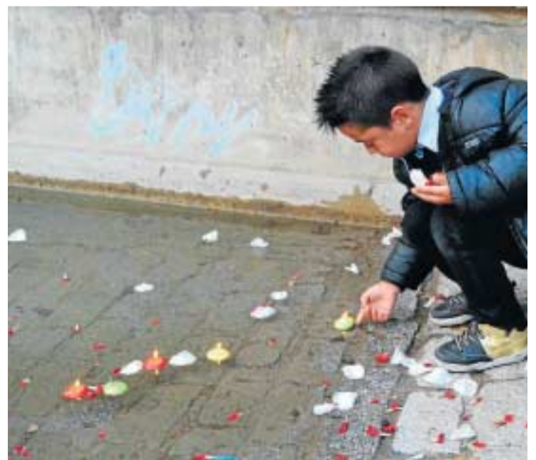
Imagen de la celebración de esta jornada el año pasado.

Romí, la Asociación Anaquerando, la Fundación Secretariado Gitano, la UGR, el Ayuntamiento de Granada, la Diputación y el Centro Sociocultural Gitano Andaluz, ha organizado una mesa redonda, que se celebrará el 19 de noviembre, sobre 'Educación, vivencias y expectativas de mujeres gitanas'. El 22 de noviembre, en la Plaza del Carmen, se procederá a los actos conmemorativos, con la lectura del manifiesto, la interpretación del himno gitano 'Gelem Gelem' y el reparto de plantas de aromáticas.