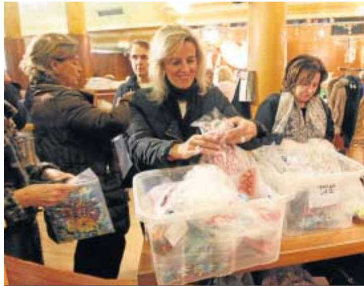
Numerosas personas adquirieron productos a muy buenos precios.

croeconómicos anuncian". En ese sentido, dijo que a pie de calle la disminución de la demanda "no se ha percibido". No obstante, aseguró que el Banco de Alimentos no tiene contacto directo con los solicitantes.