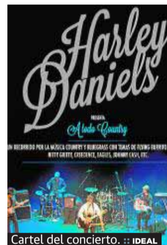
Cartel del concierto.