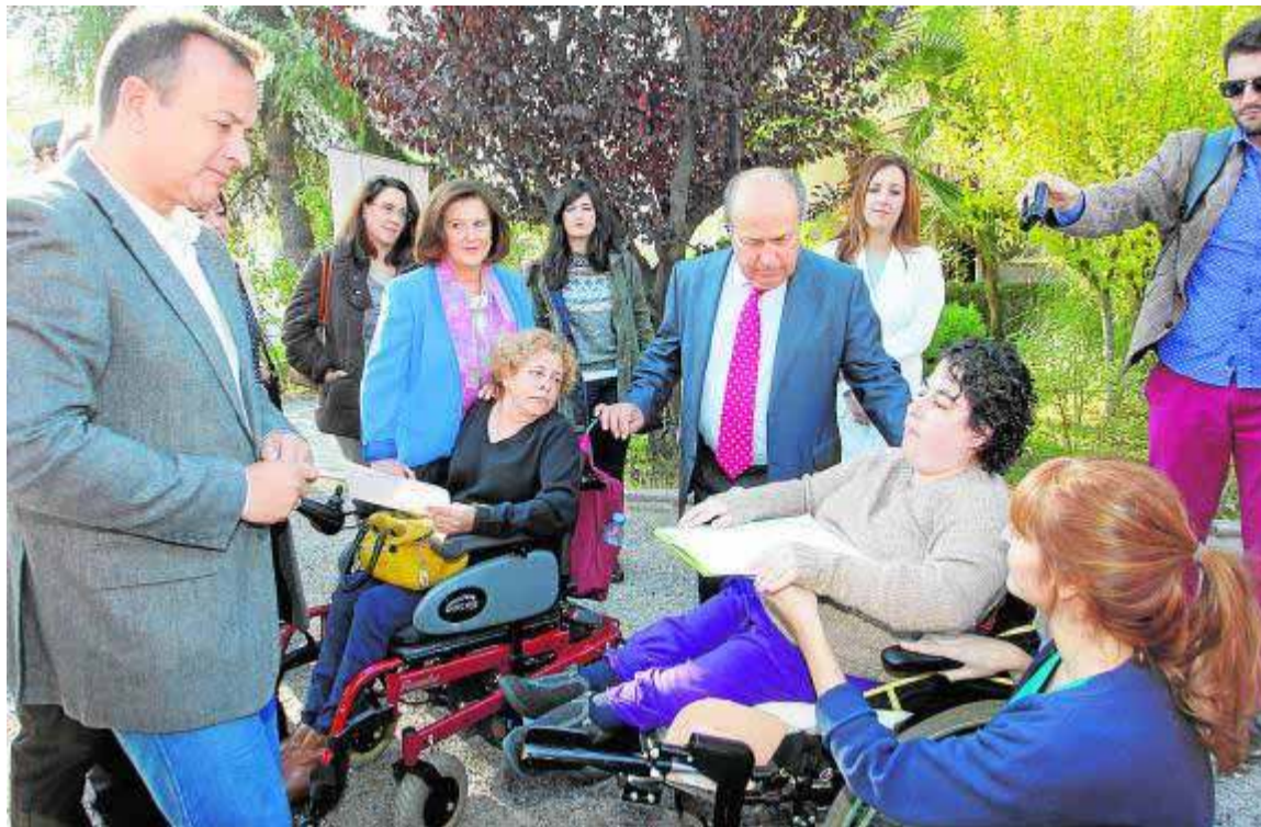
Una residente leyó un texto en braille ante las autoridades locales y autonómicas.

La parlamentaria pidió al Gobierno andaluz que repercuta en los ayuntamientos la subvención de 263 millones de euros concedida al proyecto por la Unión Europea (UE) y recordó que la obra se ejecuta desde hace nueve años con un coste de 600 millones. «Pedimos que la Junta escuche a los vecinos y a los afectados, que sea sensible y apoye a los ayuntamientos para condonar el daño ocasionado, con cientos de comercios cerrados y puestos de trabajo perdidos», apuntó García. «Los granadinos no somos ni más ni menos que los sevillanos», por lo que reclamó a la Junta que elimine el canon para subvencionar el coste del billete que no exigió en el metro de Sevilla.