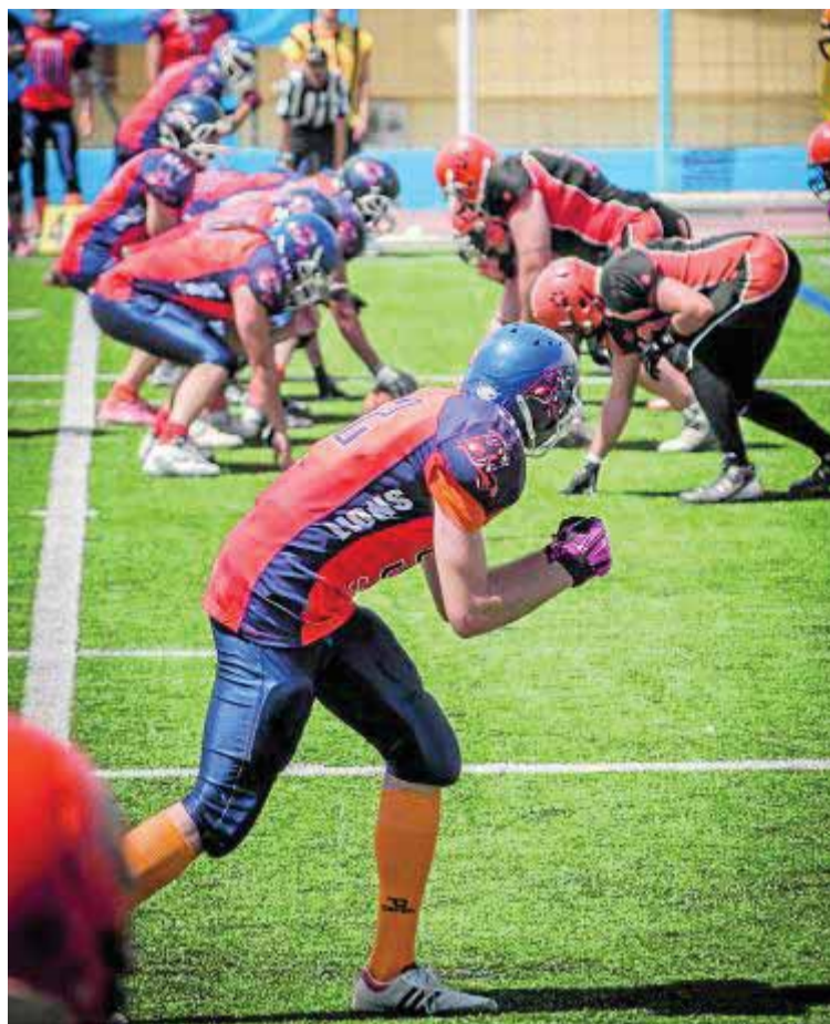
Imagen de un partido de los Lions.

El desarrollo de la Liga Andaluza, cuya primera cata se realizará en tierras almerienses, servirá como indicativo de lo que se vivirá a partir de enero, cuando empieza la Serie B. Los granadinos han quedado encuadrados en el mismo grupo que Gijón Mariners, Murcia Cobras, Camioneros de Coslada y Mallorca Voltors. Todos ellos presentan plantillas más curtidas en la Liga que los Lions, por lo que habrá que comprobar hasta qué punto lastran la inexperiencia al conjunto naranja.