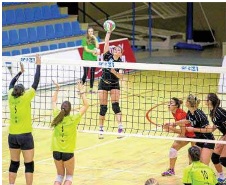
El 'Uni' sufrió la pasada semana para vencer a Murcia.

En Primera división masculina, el equipo capitalino se desplaza en esta ocasión a la localidad alicantina de Petrer para jugar ante Santo Domingo (18.30 horas). Los jugadores de Cipri Pérez buscan su primer triunfo de la campaña tras los dos reveses con los que ha iniciado el campeonato.