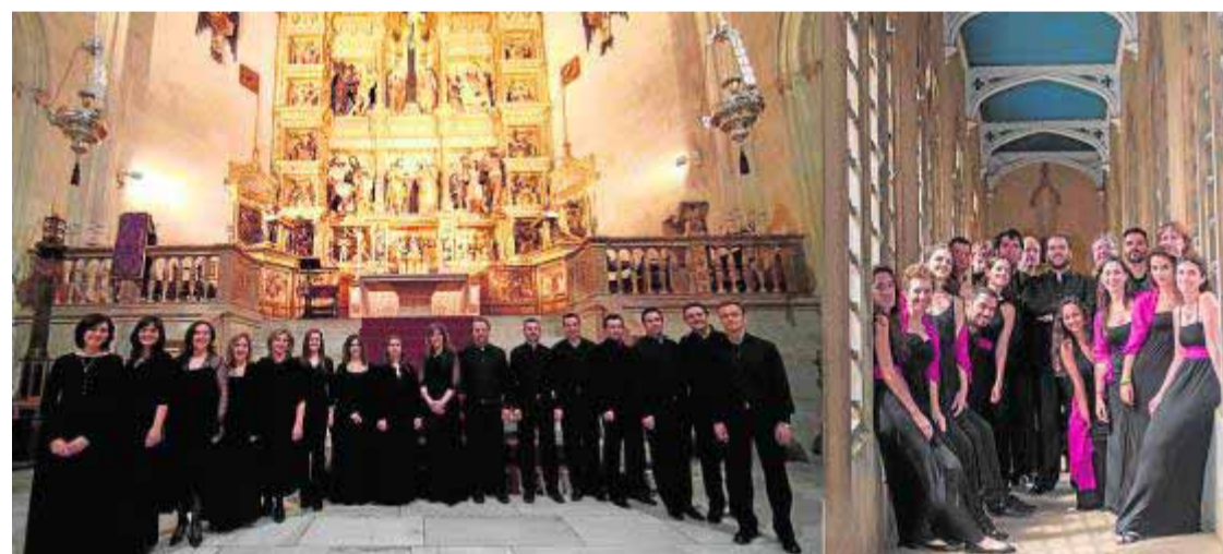
Coro Tomás Luis de Victoria. ■ IDEAL

Quienes deseen acercarse a su producción literaria e inquietudes puede acceder a su blog psicocamaleones.blogspot.com, donde publica colaboraciones, entrevistas, reseñas, poemas y relatos.