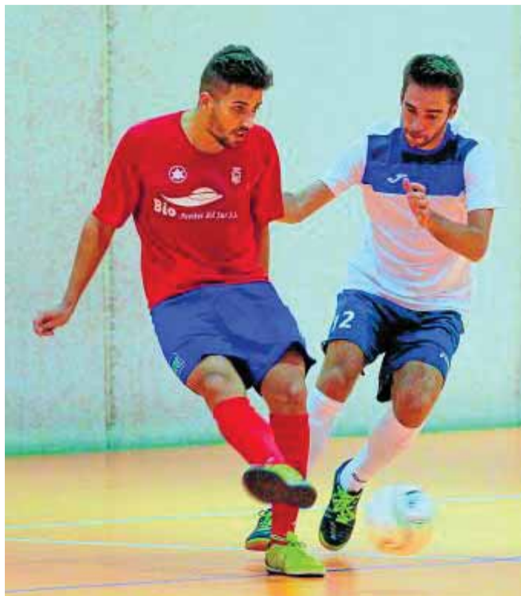
Imagen de un partido anterior del Peligros FS.

El técnico afirma que «es pronto para catalogar un partido como 'final', pero al estar el rival ahí abajo nos toca sacar lo mejor de nosotros para no meternos en problemas. El equipo está concienciado y son los