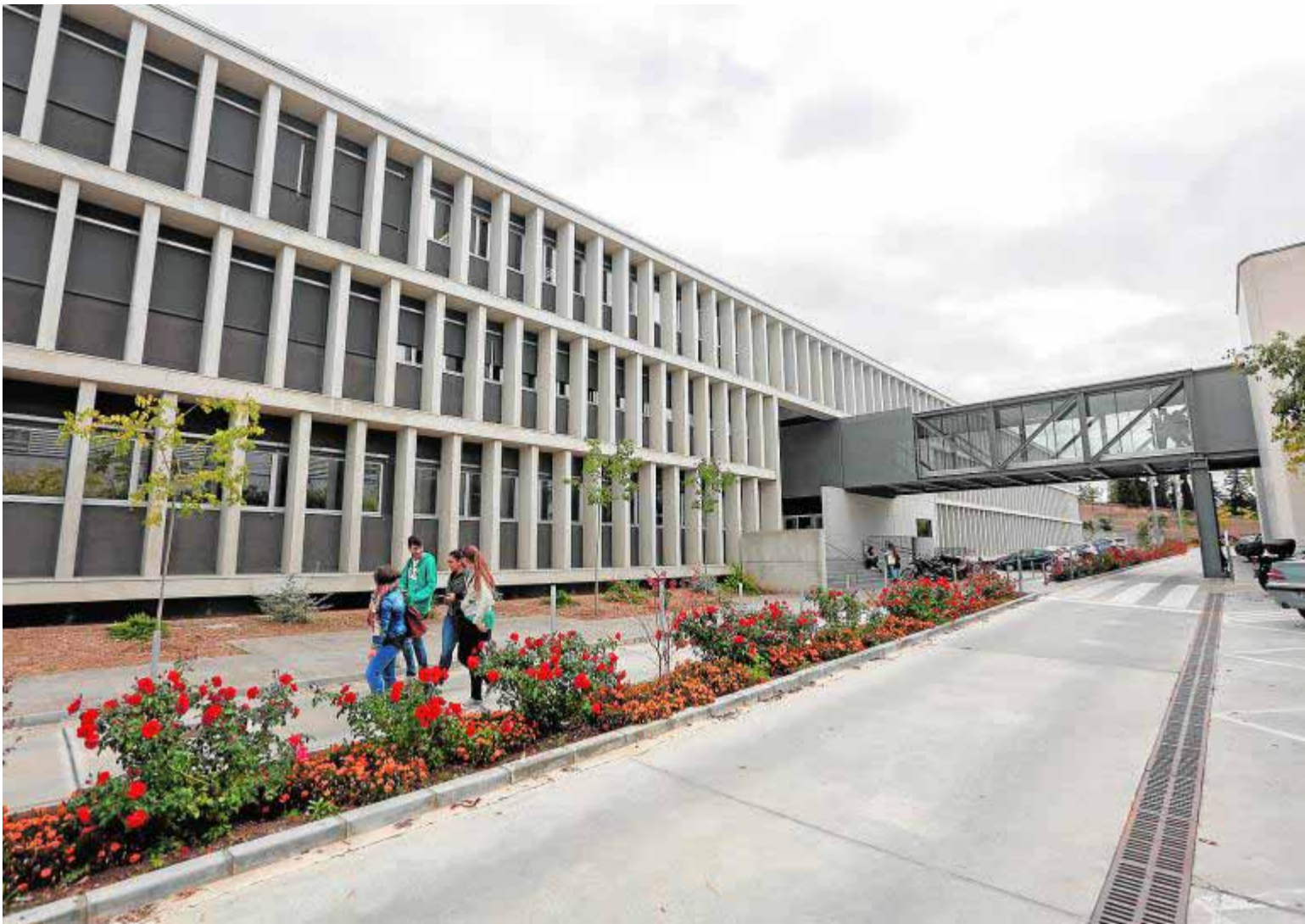
Nuevo aula de la Facultad de Ciencias Económicas y Empresariales con un presupuesto superior a los ocho millones.