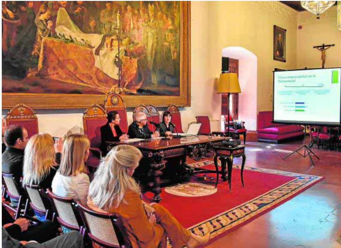
Momento de la presentación ayer del informe.

El porcentaje de emprendedores es bajo porque los estudiantes de la UGR esperan trabajar por cuenta ajena en un 76,8% de los casos al terminar sus