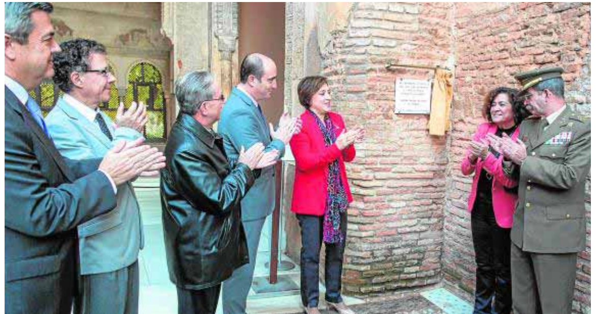
Las autoridades descubren una placa antes de inaugurar el congreso.

También tuvo un protagonismo de primer orden en el Ayuntamiento de Granada como cabeza de uno de los dos bandos que se disputaban el control de la institución municipal. Militar, diplomático, político y humanista, Íñigo López de Mendo-