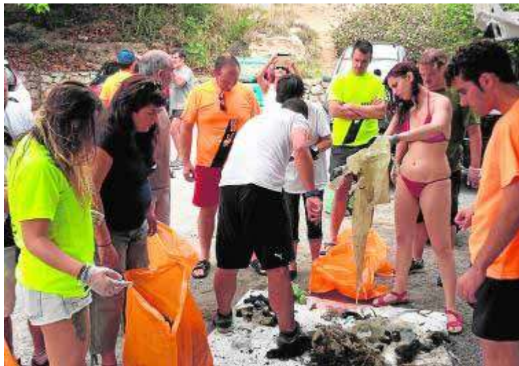
Momento del peso y clasificación de los residuos, ayer.

En la costa: colillas, plásticos y una enorme red de pesca, entre otros, sumaban casi 90 kilos. En los fondos marinos: restos de redes, ma-