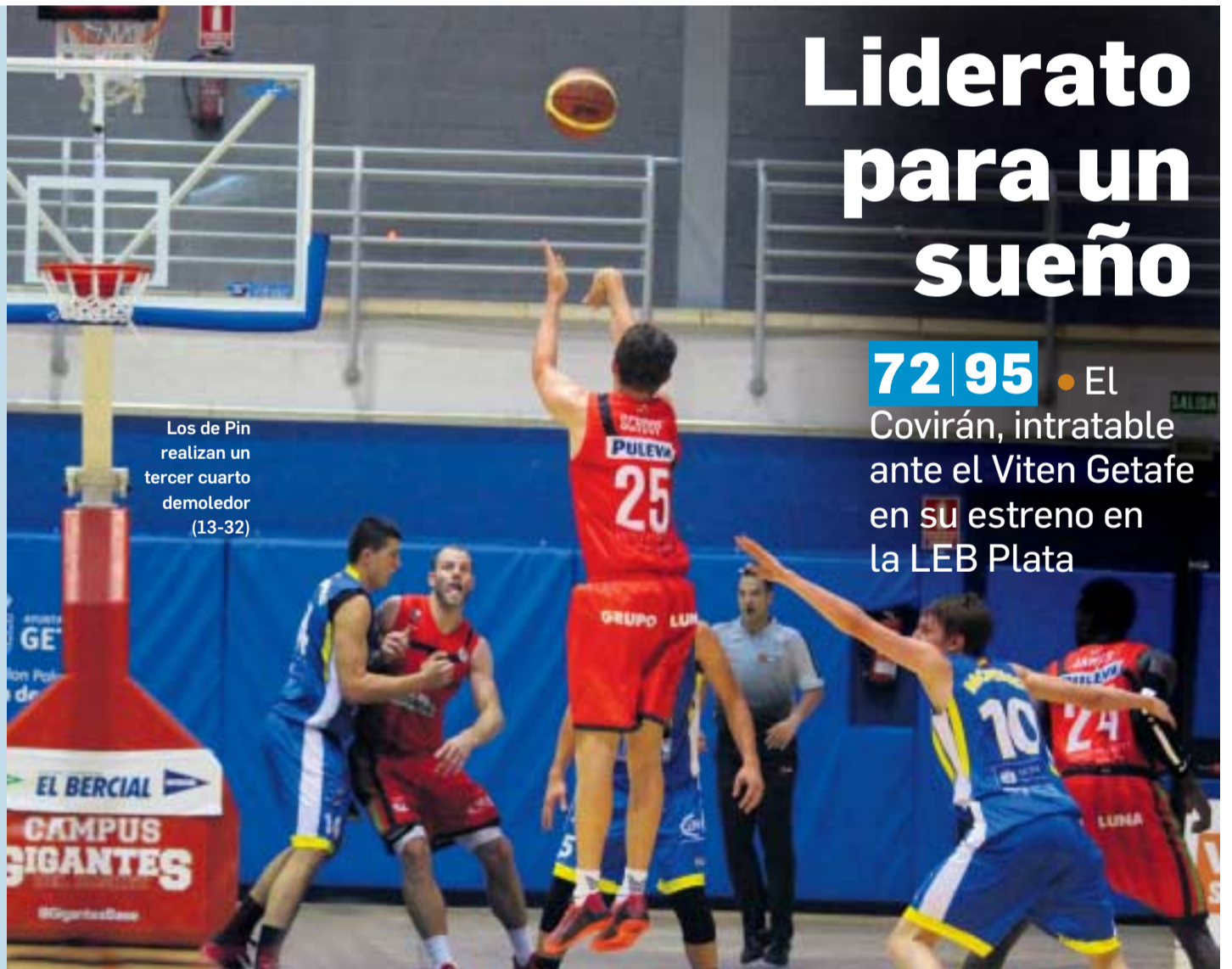
Los de Pin realizan un tercer cuarto demolidor (13-32)

El Granada, ante el peor inicio de su historia como local en Primera