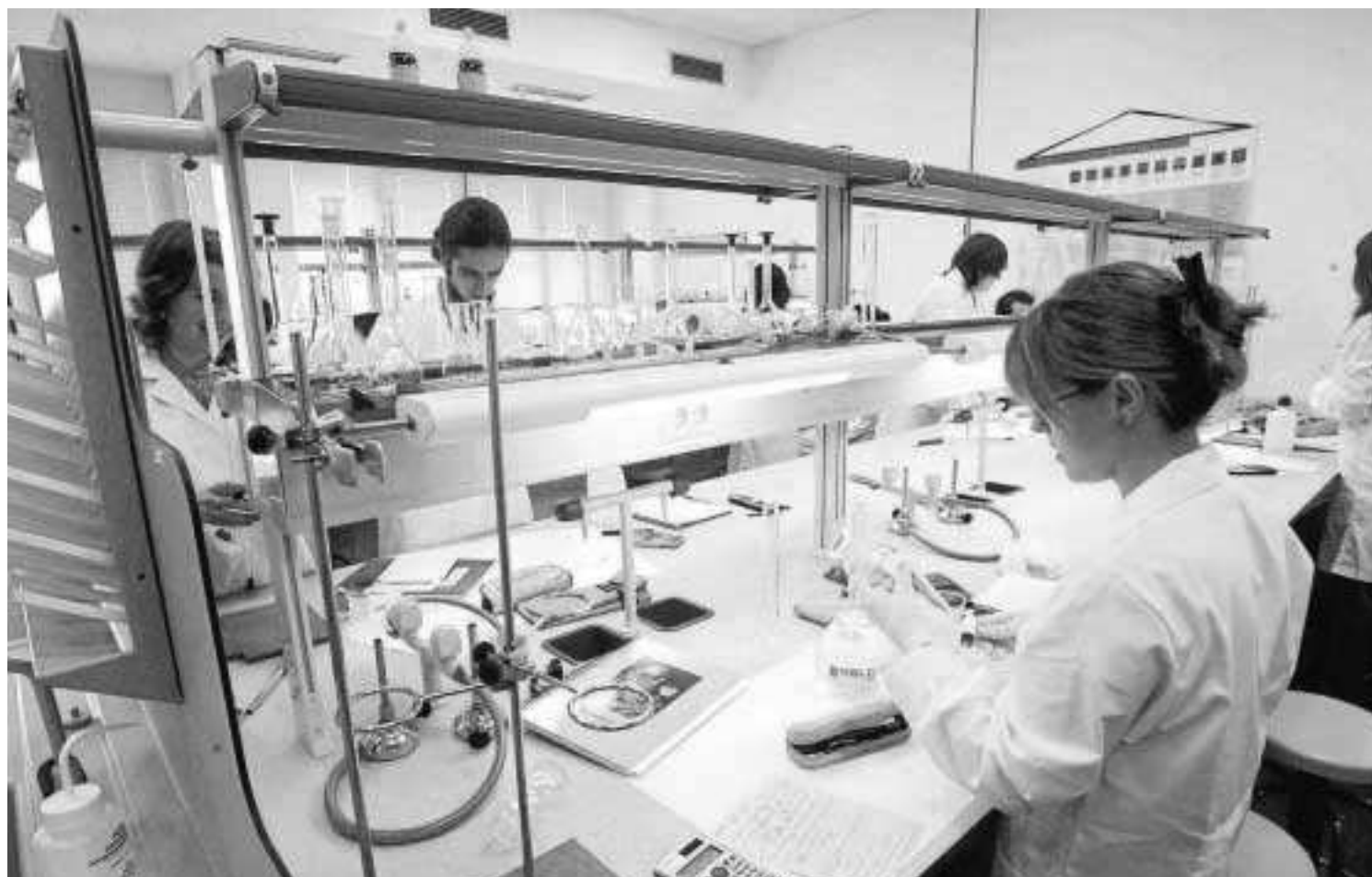
El número de contratos Ramón y Cajal que llegan a la UGR se viene reduciendo cada año.

La competencia es grande. El Ramón y Cajal es uno de los principales programas de ayudas a investigadores dirigido a doctores, españoles o extranjeros, con hasta diez años de experiencia postdoctoral y con una trayectoria destacada y consolidada en organismos de investigación. Son personas que han tenido que demostrar ya su talento con publicaciones importantes en revis-