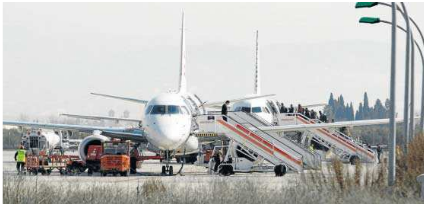
El aeródromo granadino sufrió en primera persona la crisis del sector aeronáutico y la fuga de vuelos 'low cost'.

● El futuro de la terminal granadina comenzará a despejarse en tres semanas en un encuentro que se espera con sensaciones "positivas"