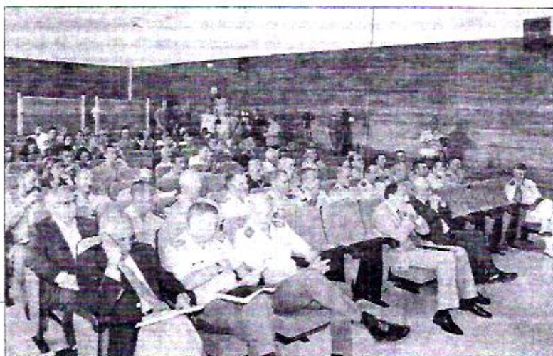
Los profesionales del Ejército suelen tener una presencia importante en los cursos

por tanto, es cada vez más necesaria para protegernos de la delincuencia, ciberterrorismo y ciberguerra. El gasto mundial crece continuamente y a su vez las empresas y la administración contratan a los que se conocen como hackers, hipsters y hustlers.