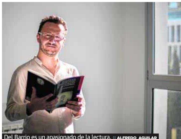
Del Barrio es un apasionado de la lectura.

–Recuerdo que me acerqué a leer mi primer periódico con 8 o 9 años, estando en el colegio, cuando un maestro nos mandó un trabajo de selección de una noticia de ámbito local para después hacer un comentario de la misma. Me costó seleccionar una de las noticias porque la mayoría trataban temas de política, que a mí no me interesaban nada, pero ya me pareció apasionante el trabajo de los periodistas.