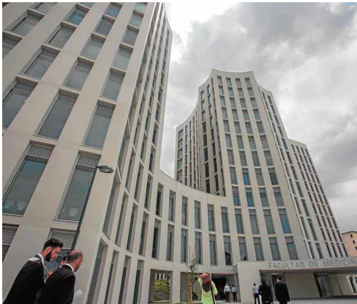
La nueva Facultad de Medicina recibirá a sus inquilinos el próximo curso.

Los arquitectos, hubo concurso público, han sido Antonio Cruz Villalón y Antonio Ortiz García. Los estudiantes, según la ficha técnica