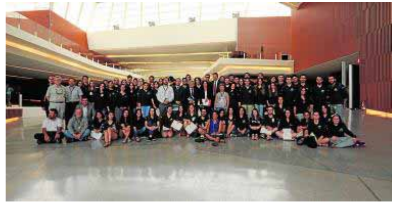
Acto de entrega de las ayudas a los animadores científicos.

ritu científico y señalando que la entidad seguirá apoyando iniciativas como esta que ya han permitido a más de 1.400 estudiantes de todas las facultades granadinas disfrutar de una beca en el Parque de las Ciencias. Ya ha alcanzado su décimo aniversario esta iniciativa.