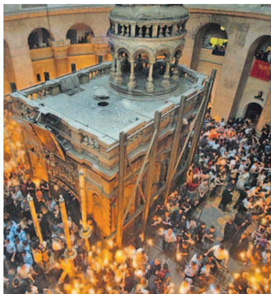
Semana Santa ortodoxa, que podría coincidir con la católica. GIBBON

Por ello insistió en que tienen que «ponerse de acuerdo» y mostró la disposición de la Iglesia católica a «renunciar al primer solsticio después de la luna llena de marzo», una propuesta que motivó el aplauso de los sacerdotes, obispos y cardenales presentes. Según recordó el papa, Bartolomé permitió en Finlandia que los ortodoxos, que son minoría, celebren la Pascua en la fecha de los luteranos, pues, si no, según el papa, es «un escándalo: ¿Cuándo resucita tu Cristo? Mi Cristo hoy, el tuyo la semana que viene», ironizó. La propuesta, sin embargo, no será fácil de llevar a cabo.