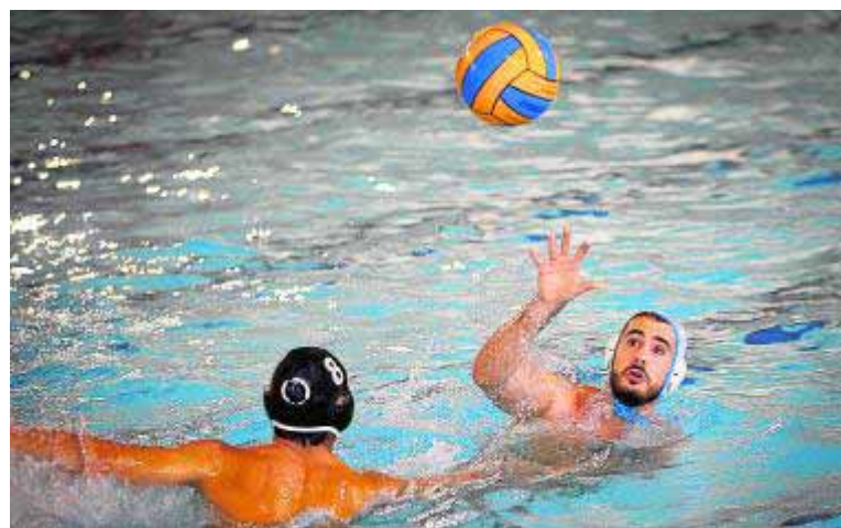
En espera de la recepción del balón.

Incidencias: Partido disputado en la piscina de Torre del Mar (Málaga) ante algo más de un centenar de espectadores.