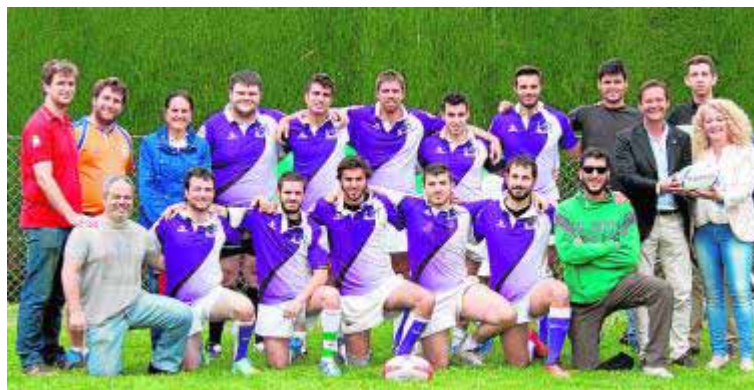
Foto de familia del torneo benéfico de rugby.

Esta iniciativa deportiva que pretende dar a conocer una enfermedad que reduce de forma notable la calidad de vida del paciente ha sido posible gracias a la Facultad de Farmacia y la Universidad de Granada, así como al apoyo de la Diputación, Ayuntamiento de Granada y la Federación Española de Rugby.