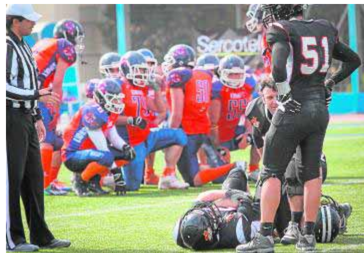
Un jugador, tendido en el suelo, se duele de un golpe.