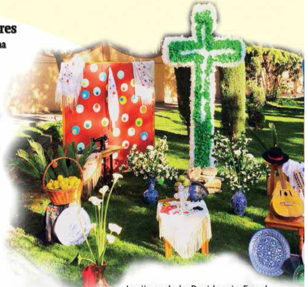
Jardines de la Residencia Ecoplar

El domingo 3 de mayo, día de la Santa Cruz, los residentes y sus familiares disfrutarán de una jornada festiva en la que se celebrará la Eucaristía. Tras la ceremonia disfrutarán de las típicas habas y salaillas, en un entorno envidiable, ubicado en el barrio del Albayzin.