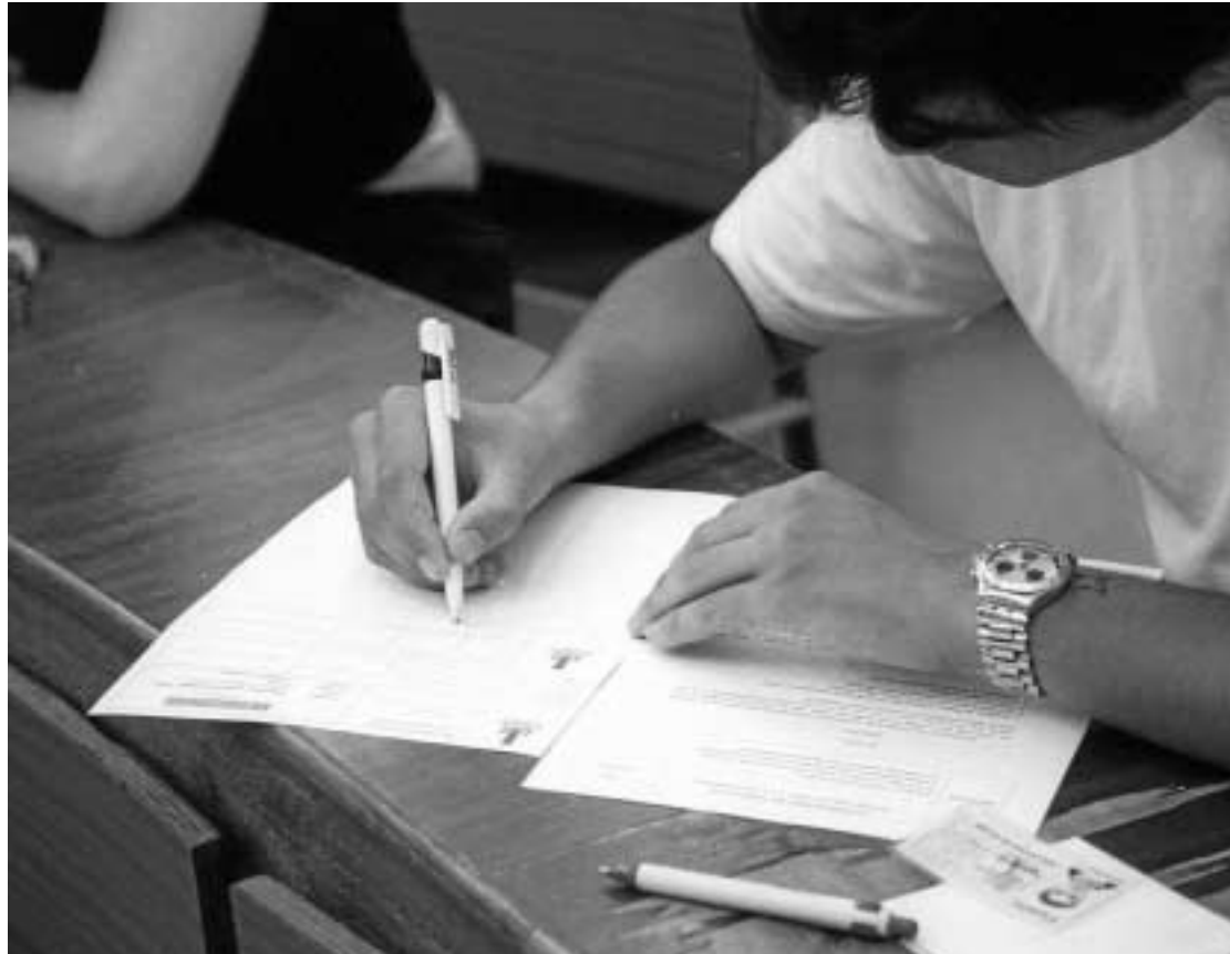
Algunos alumnos ya han adelantado sus exámenes de febrero.

“Si queremos tener una buena adaptación en Europa, este sis-