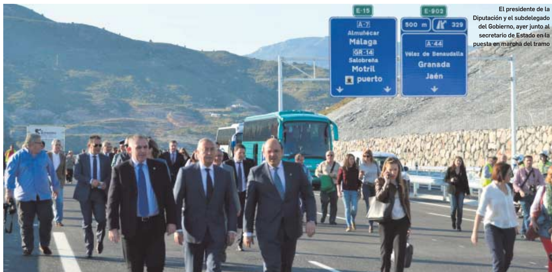
El presidente de la Diputación y el subdelegado del Gobierno, ayer junto al secretario de Estado en la puesta en marcha del tramo

6-7 FOTOS DE FIN DE MANDATO: DEL COLEGIO DE LAS NIÑAS NOBLES A LA AUTOVÍA DEL MEDITERRÁNEO