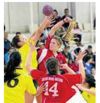
Un partido del 'Uni'.