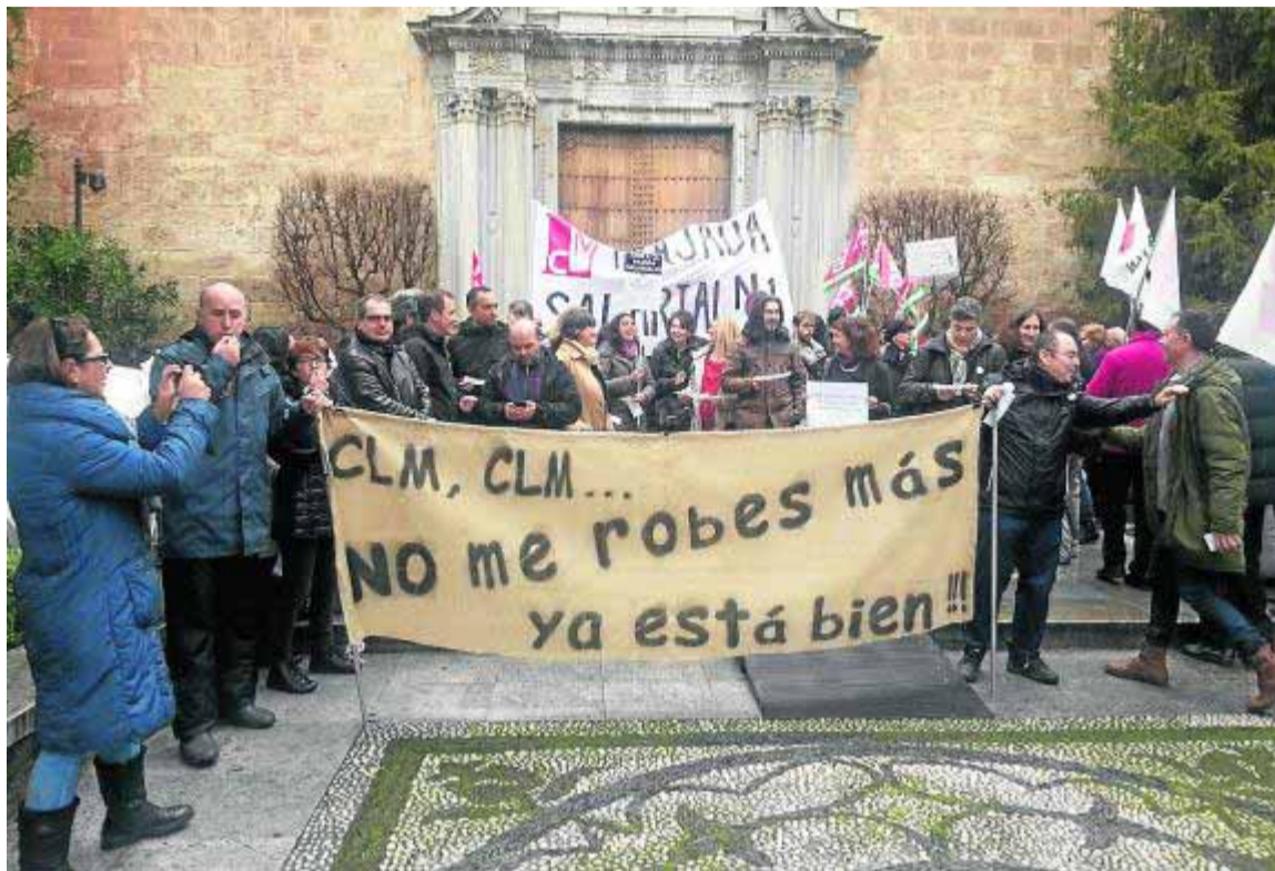
Concentración en el Rectorado de la UGR, ayer, contra la reforma universitaria y los recortes.