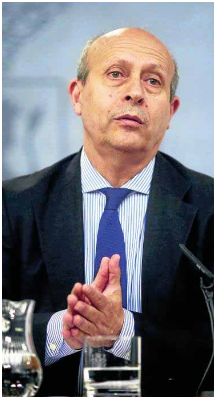
Wert, ayer en la rueda de prensa del Consejo de Ministros. :: O DEL POZO

La norma se aprobó ayer tras un informe negativo del Consejo de Estado, que reclamó al ministro que no precipitase la reforma, y críticas de buena parte de la comunidad educativa. «Lo que han hecho es trasladar algunas observaciones de oportunidad que son fruto de opiniones que les han dado