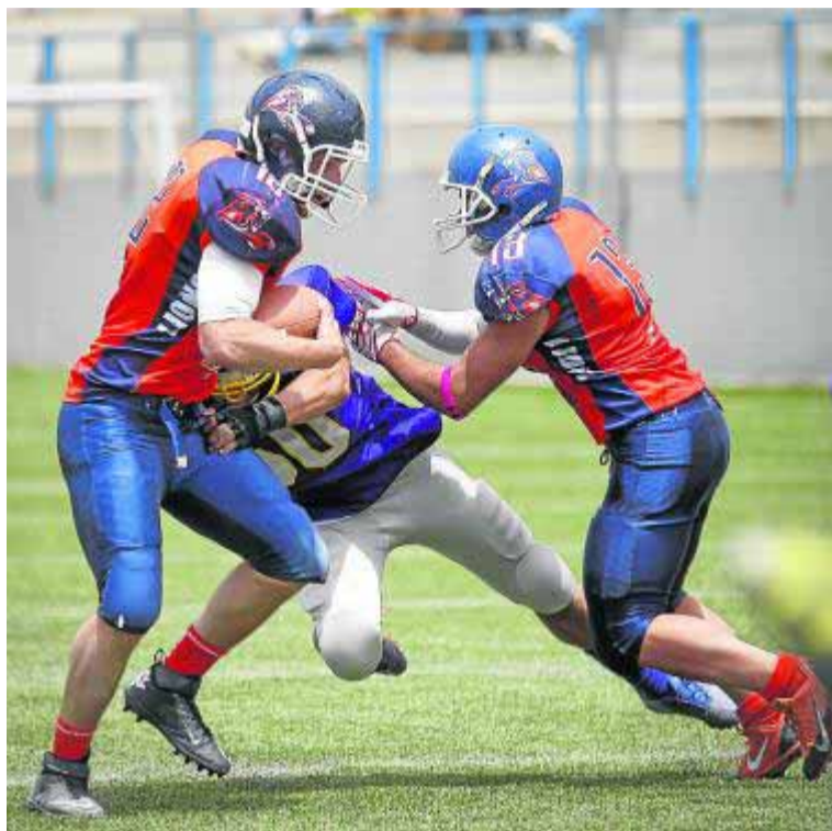
Imagen de un partido anterior de los Lions.

Los malagueños comandan la tabla andaluza y también la nacional en la Serie C, lo que demuestra que los malagueños se encuentran en un buen momento de forma. Ese