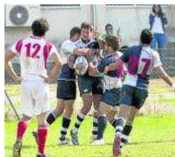
El Universidad se la juega. :: G. M.

El entrenador Manolo Conde presenta en esta ocasión un problema