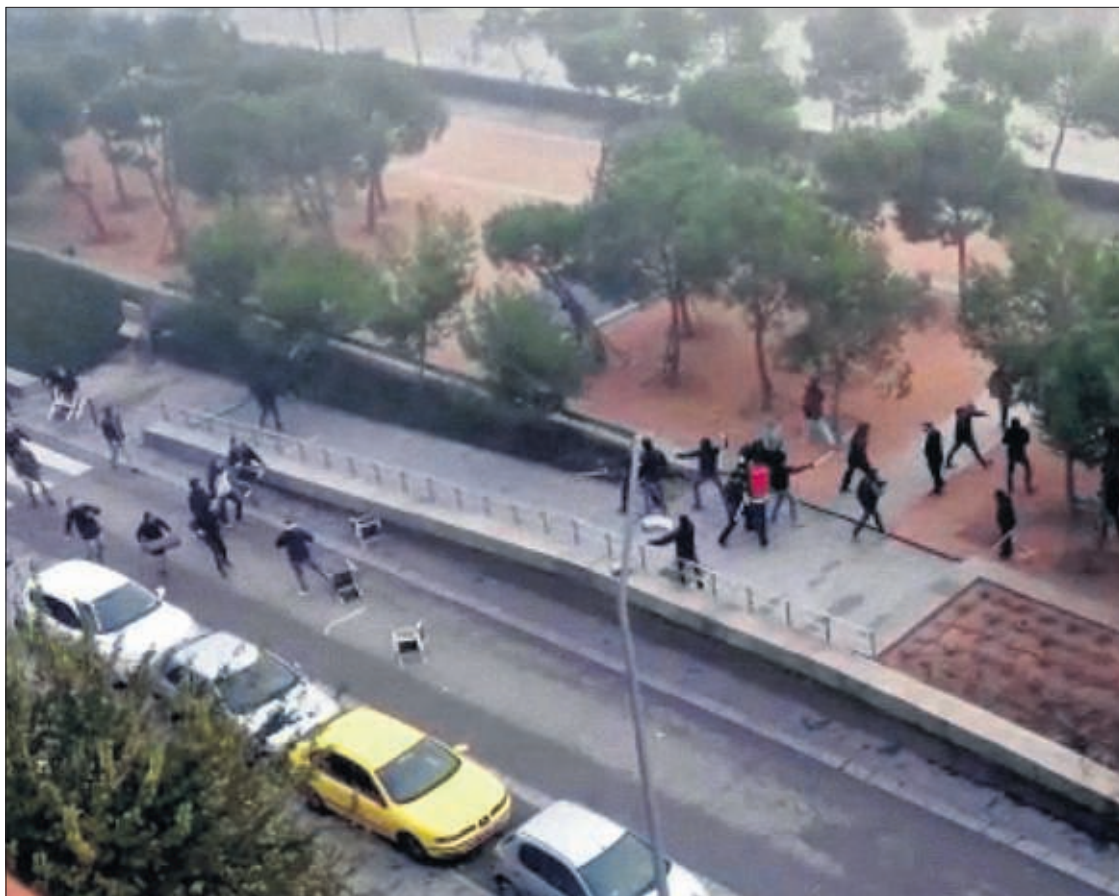
Imagen de un vídeo grabado por un vecino durante los incidentes en la zona de Madrid Río.

Añade el texto que “será bueno recordar que la mayoría de los líderes de Podemos proceden de Izquierda Anticapitalista y organizaciones de extrema izquierda afines” y que Pablo Iglesias y el resto de la cúpula del nuevo partido no son unos neófitos de la política, sino que llevan años ejerciéndola en otros foros. Esta estrategia para las elecciones se distribuirá hoy por toda la organización. En ella se apuntan argumentos muy elaborados no solo contra Podemos, sino también contra el PP. PÁGINAS 10 Y 11