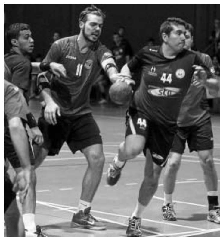
Un jugador del Maracena se prepara para lanzar contra la portería contraria. PEPE VILLOSLADA

Al espectáculo se sumaron los guardametas pero no los colegiados, que no hicieron un gol al tanteo de Montequinto pese a concederlo en pista, al equipo sevillano le excluyeron entonces al entrenador, expulsaron al médico local y remataron el final con las exclusiones de Gonzalo y Ángel Sánchez que incapacitaron al equipo maracenero para pelear el último y definitivo parcial al acabar el partido con sólo cuatro jugadores.