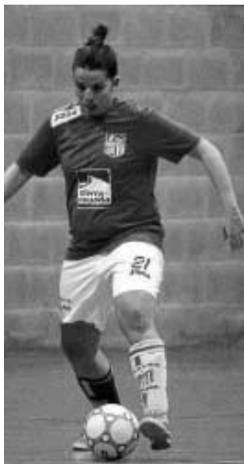
Acción de ataque de las serranas.

Demasiado castigo para el Monachil 2013, que cayó derrotado 4-7 ante uno de los gallitos de la cate-