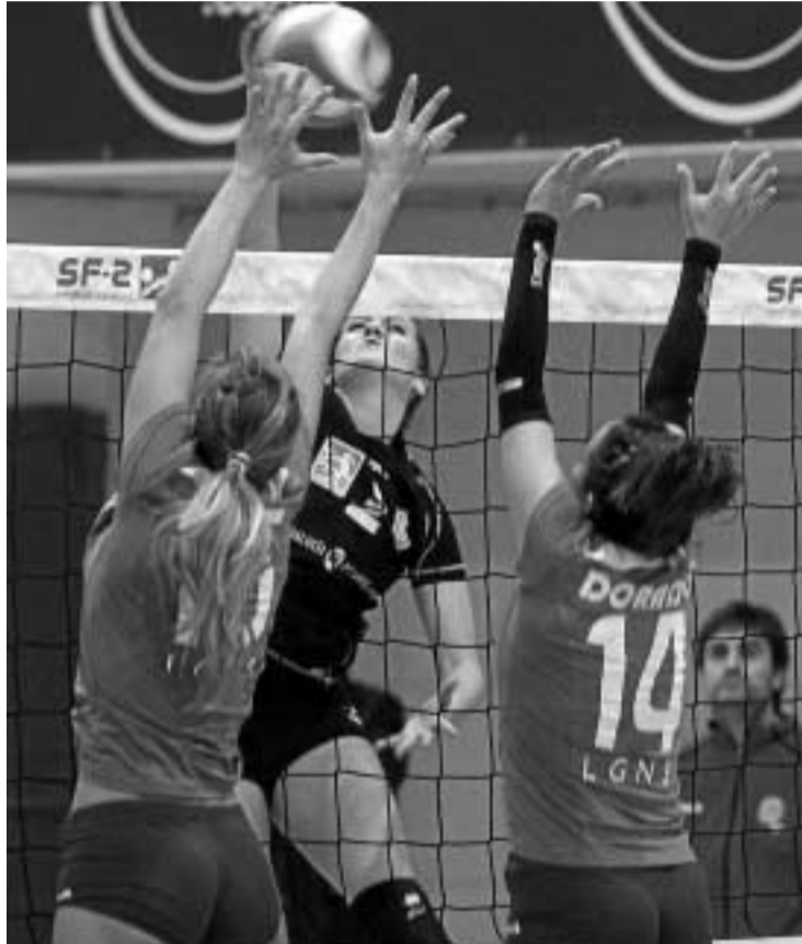
Un remate del Uni durante el choque de ayer en Fuentenueva.