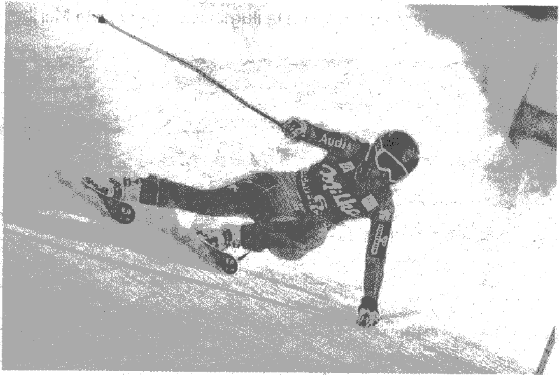
La estación acogerá dieciséis finales de esquí alpino, freestyle ski y snowboard.

La pista Universiada tiene una serie de características para las diferentes disciplinas. Así, para el slalom y con una longitud de 610 metros. En el caso del Slalom Gigante la longitud de la pista será de 1.360 metros; en Super Gigante contará con una pista de 2.246 metros de longitud lo mismo que en descenso. El resto de modalidades, es decir, freestyle y snowboard, se disputarán en el snowpark Sulayr de la Loma de Dílar.