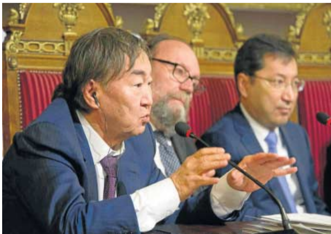
El embajador, ayer durante su intervención.

La UGR, a través del Centro de Promoción de Empleo y Prácticas del Vicerrectorado de Estudiantes, ha impulsado la obtención de este reconocimiento por parte del Ministerio de Empleo y Seguridad Social, acreditándose de esta manera su compromiso e implicación con la sociedad a la que se debe su Universidad en el ámbito de la formación práctica de sus alumnos y en la inserción laboral de sus egresados.