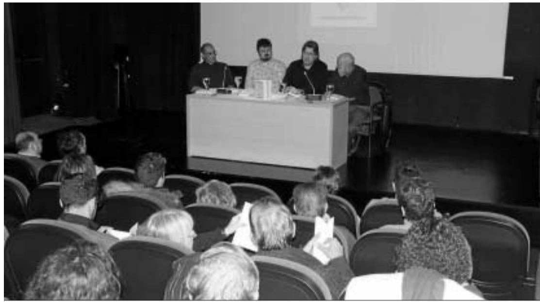
Presentación del volumen en el Palacio de los Condes de Gábia.