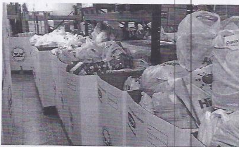
Imagen del almacén del Banco de Alimentos de Melilla tras recoger los productos el sábado por la noche.

Paredes asegura que fue "increíble" ver cómo familias salían con