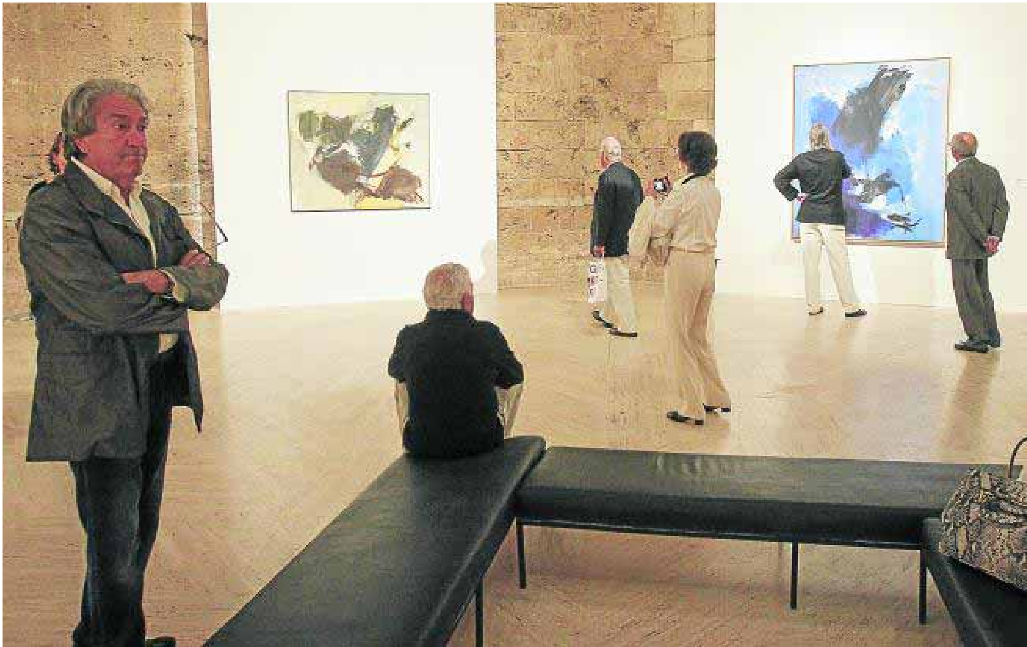
A los actos del centenario de Guerrero se han sumado la Alhambra, la Universidad de Granada, el Festival de Música y Danza y el Auditorio Manuel de Falla.

▶ terminar. «Uno de los primeros objetivos con que planificamos las actividades era darle la mayor difusión posible al trabajo de José Guerrero, y esto se ha conseguido», señaló Yolanda Romero. Y se ha logrado llevar la figura del artista a públicos muy distintos a los habituales del centro implicando, además, a instituciones diversas. Así, por ejemplo, investigadores de distintas disciplinas participaron la semana pasada en el congreso 'Poéticas del color y del límite', promovido por el Departamento de Estética de la Universidad de Granada. Miles de aficionados a la música pudieron ver las obras de Guerrero en los materiales promocionales del Festival de Música y Danza, que organizó un ciclo musical en torno a su figura, y en la exposición de 'Canciones del color' y 'Azul vibrante' que exhibió en primavera el Auditorio Manuel de Falla. El Ayuntamiento colocó una placa conmemorativa en el que fuera su estudio en el Carmen de Matamoros e inició los trámites para poner el nombre del artista a una calle de la ciudad.