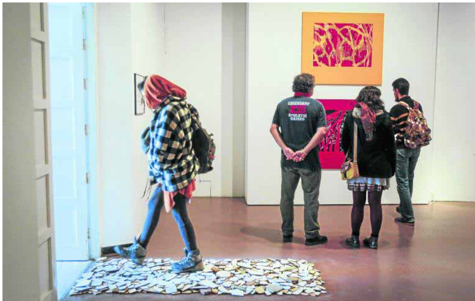
Una visitante camina sobre una instalación que forma parte del homenaje a Guerrero en la Facultad de Bellas Artes.

se han exhibido estos meses en el Palacio Strozzi de Florencia y en museos de Tokio y Nagasaki. En cambio, se quedó en el tintero la pequeña exposición monográfica prevista en el Instituto Cervantes de París, que aún está pendiente de fecha.