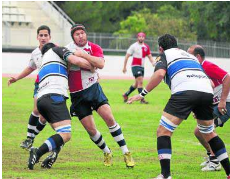
Jugada del partido de ayer en La Cartuja de Sevilla.