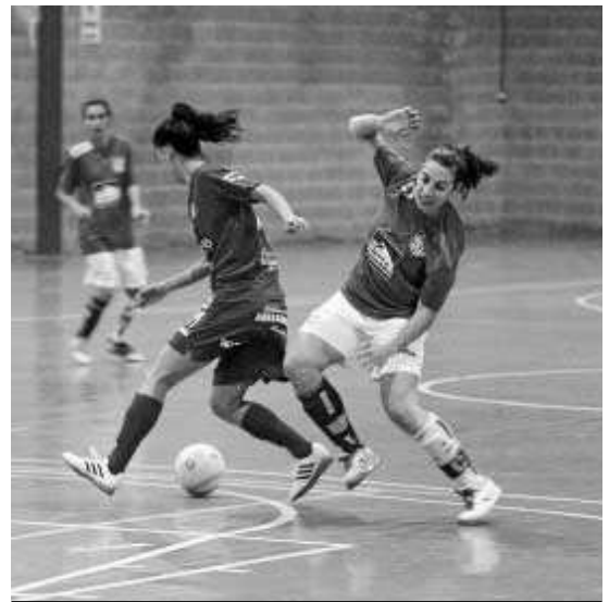
El Monachil respirará en la tabla si gana esta jornada.

El Villanueva Mesía podría beneficiarse del choque del otro representante de la provincia, el Loja, que se verá esta tarde las caras con el Villa del Río (17:00), tercero en la tabla y que se encuentra empatado a puntos con el Villanueva.