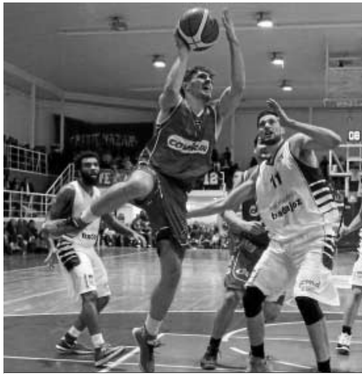
Didi entra a canasta en el choque de la pasada jornada.