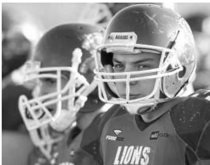
Los Lions están preparados para la nueva temporada.

Los Granada Lions harán historia esta tarde. Y es que el cuadro granadino jugará su primer partido internacional de su historia. Tendrá carácter amistoso y medirá a los naranjas, en pleno proceso de preparación de la temporada, con el equipo irlandés de la Universidad de Limerick. Además, la cita tendrá fines benéficos ya que se realizará una recogida de alimentos en colaboración con Cruz Roja pa-