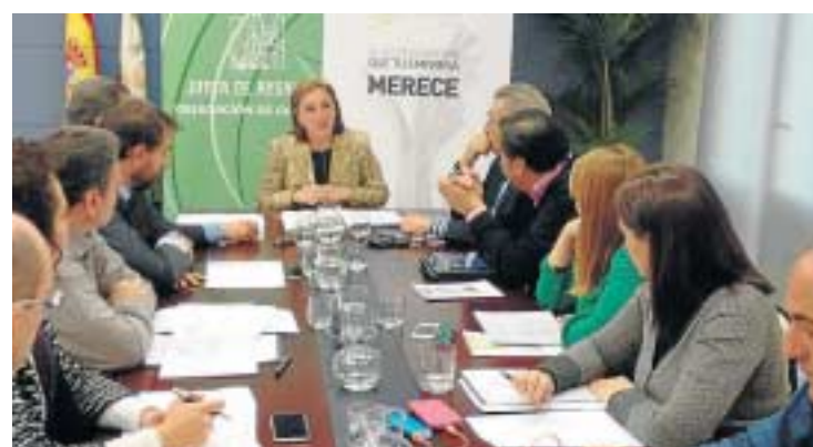
El comité organizador de los Premios Alas durante el proceso de selección.

vacación, Ciencia y Empleo a través de Extenda. Las empresas granadinas candidatas a lograr los galardones son Jalsosa en la categoría 'Iniciación a la Exportación', Procam en 'Empresa Exportadora' y Aceites Maeva en 'Impulsación Exterior'.