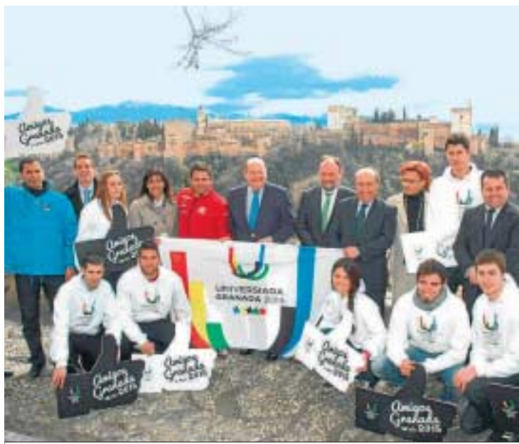
Los primeros voluntarios, en una imagen de archivo de 2013.