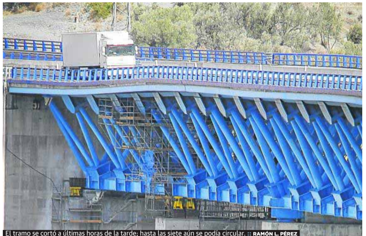
El tramo se cortó a últimas horas de la tarde; hasta las siete aún se podía circular.

Uno de los requisitos para ello es que las cuentas municipales se cierren con estabilidad presupuestaria, «algo que no ha ocurrido en el Ayuntamiento de Granada, que cerró el 2013 con un déficit de 15 millones de euros, con lo cual no puede acogerse a esta ampliación del plazo» que podría haber supuesto que la capital pasase de pagar 2.300.000 euros al año por este concepto a 950.000 euros.