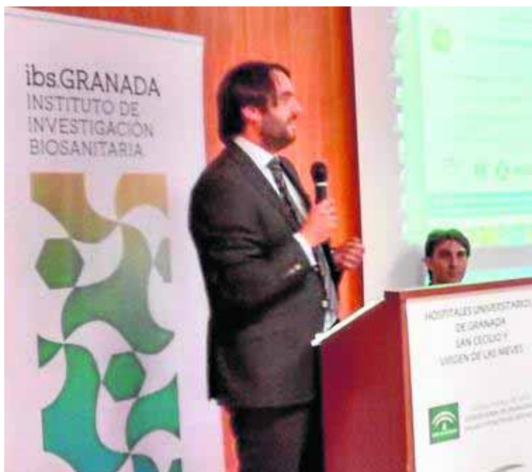
Intervención de la Fundación Medina, ayer en el Clínico.

Los mismos avanzaron que están a punto de obtener licencias para kits de diagnóstico de cáncer de páncreas y de pulmón. Esos utensilios determinan la respuesta del paciente ante la quimioterapia. «También estamos culminando el proyecto de daño renal. Mediante una simple muestra de orina, con una técnica no invasiva, se sabe si el paciente