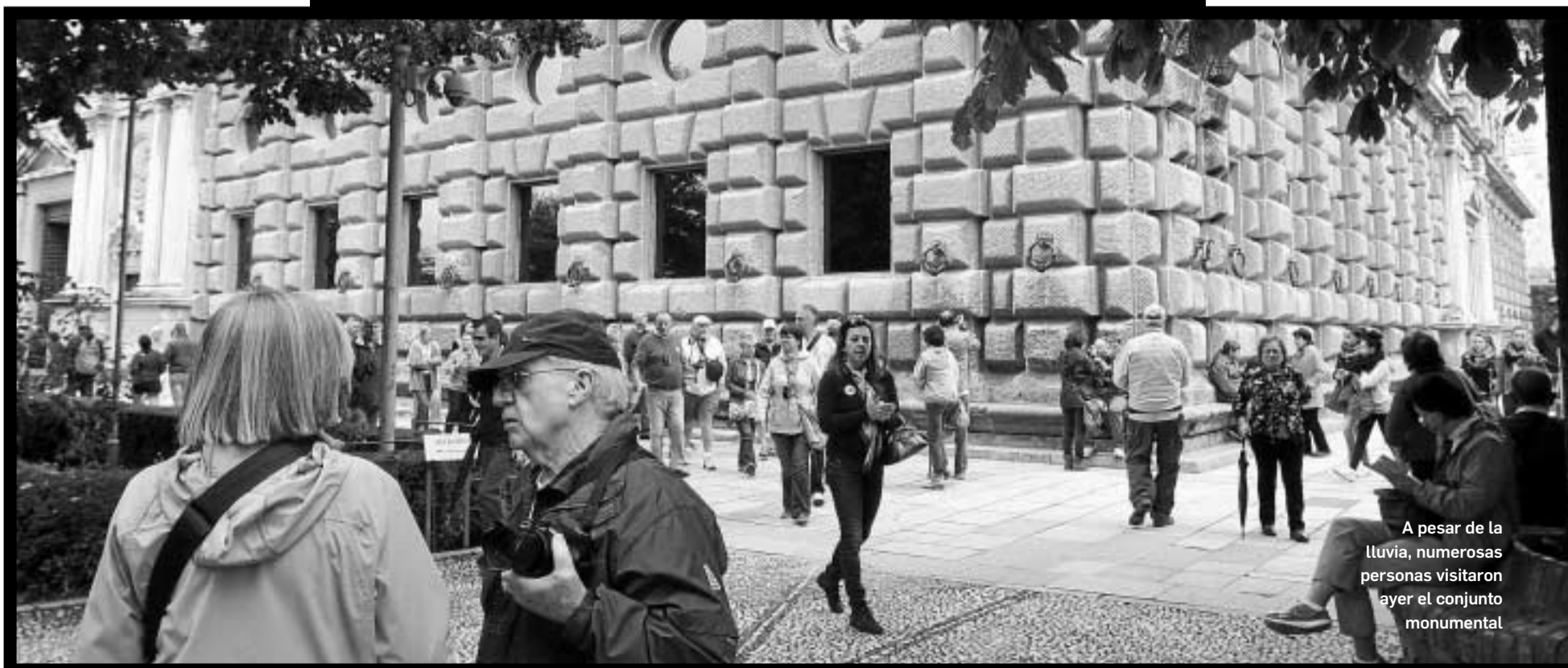
A pesar de la lluvia, numerosas personas visitaron ayer el conjunto monumental

Por último, también se ha redactado una Carta Arqueológica que permite la identificación de las alteraciones que ha podido sufrir el registro arqueológico y la valoración del potencial que presentan para el desarrollo de investigaciones futuras así como necesidades de conservación. También se ha recogido un documento con los materiales arqueológicos recogidos y