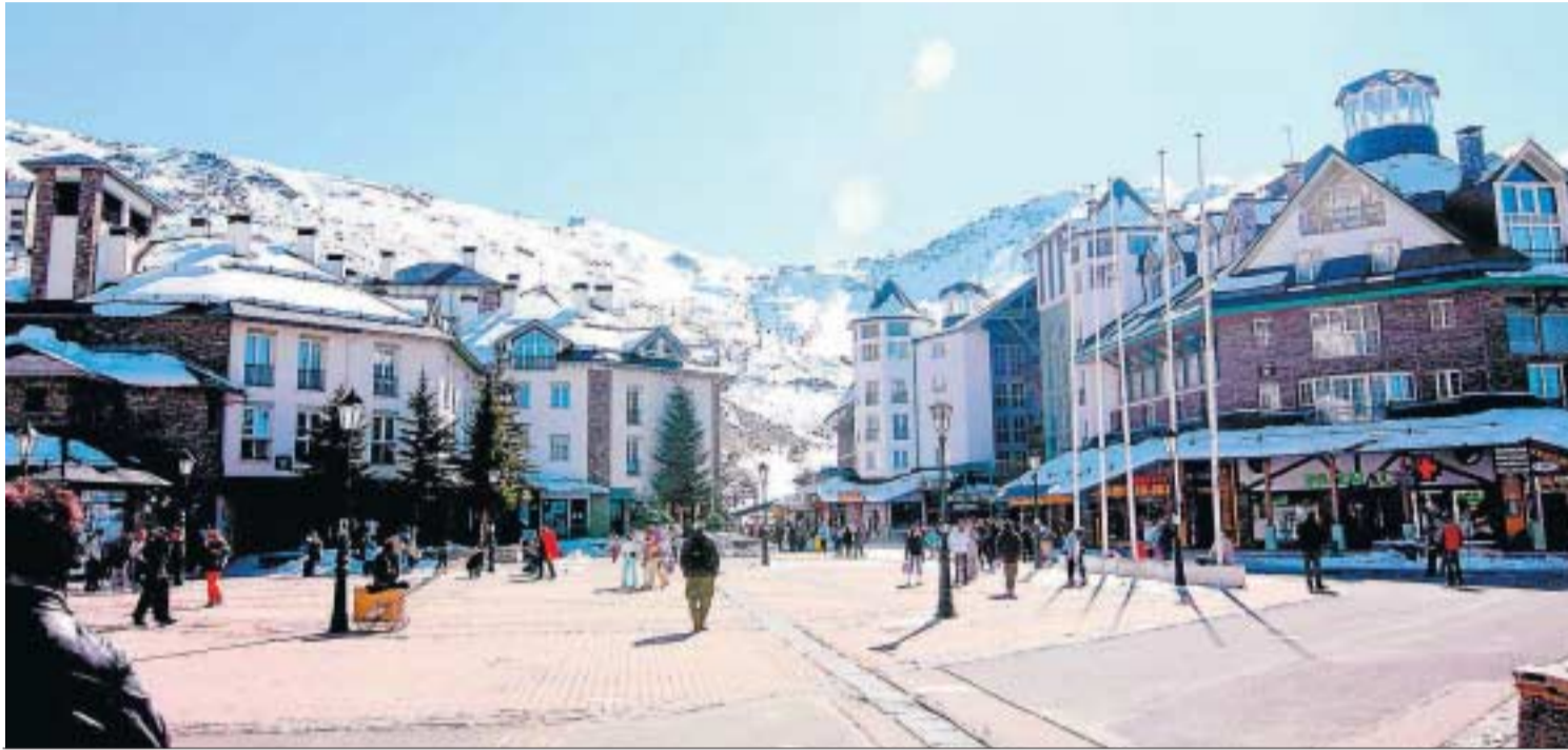
Las empresas que decidan patrocinar la Universiada tendrán exenciones fiscales.

● Las administraciones ya están valorando cuánto tendría que aportar cada una para cubrir la parte que debían aportar las empresas