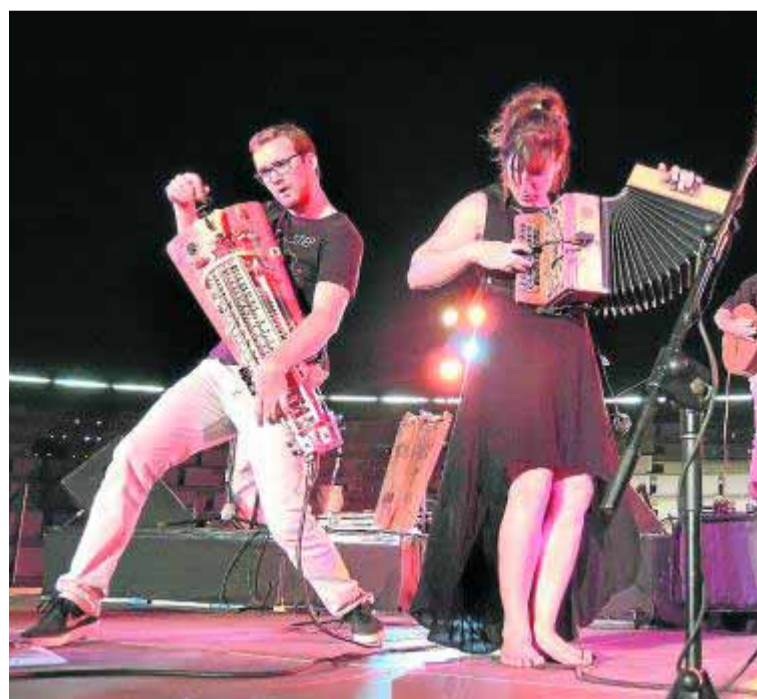
Actuación de Xarnege en el anfiteatro del Palacio de Congresos.