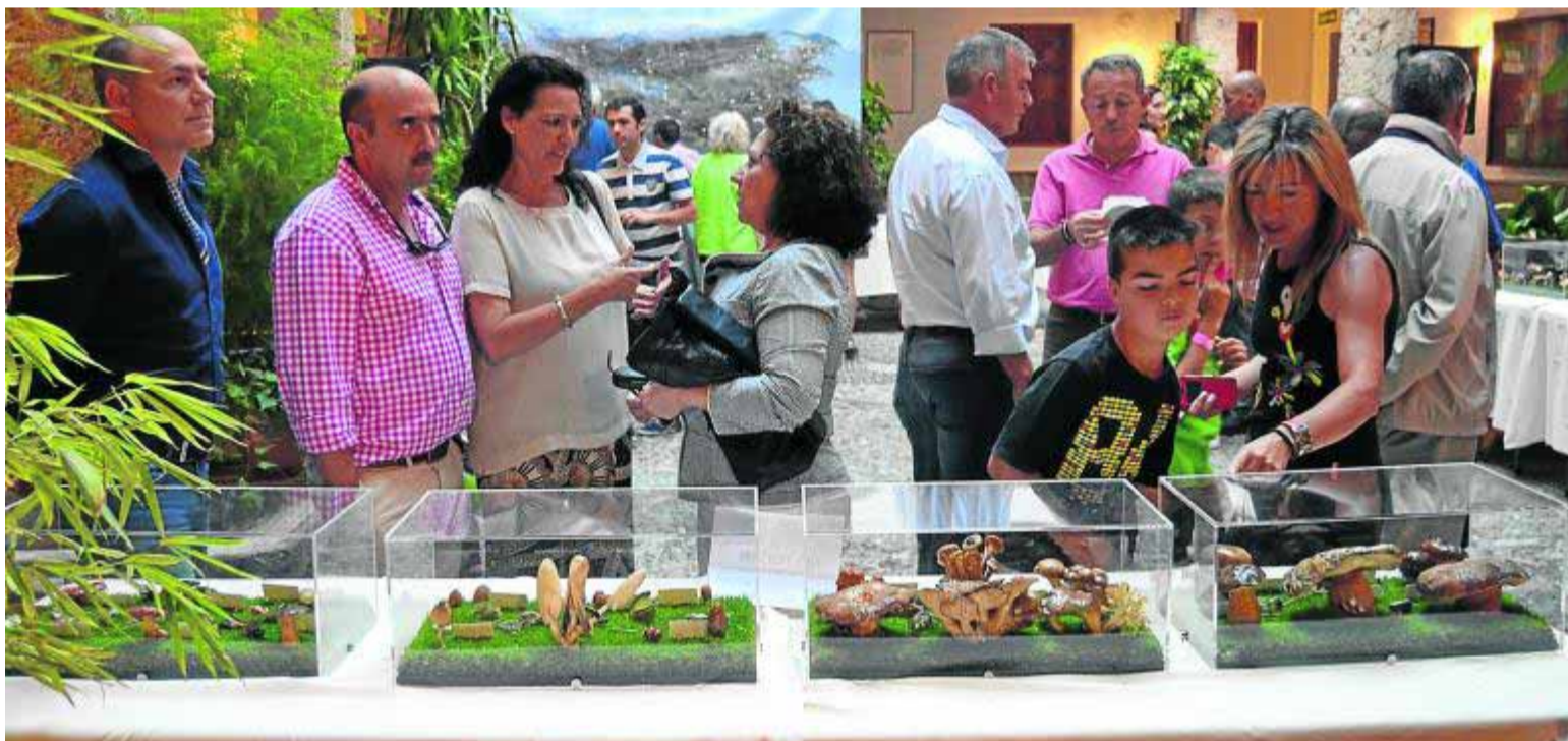
La Corrala de Santiago, de la UGR, se ha convertido en escenario de esta particular exhibición. ■ A. ARENAS

No obstante, con independencia de que un alumno se haya matriculado o no, este podrá permanecer en listas de resulta en previsión de posteriores anulaciones de matrícula.