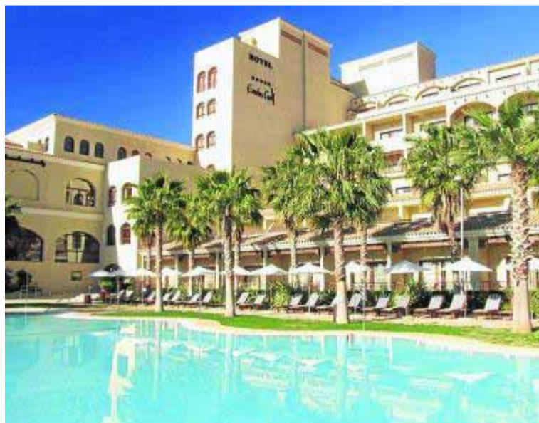
Vista de la piscina exterior y parte del 'cinco' estrellas :: ARCHIVO

Lugar: Hotel Envía Almería Wellness & Golf Spa y piscina exterior Dirección: Avda. de la Envía 37, Urb. La Envía Golf 04727 Almería, España. Autovía A-7 Salida 429. (Dirección Enix-Felix) Teléfono: 950 181 100 Restaurante: Atento servicio, dispone de bares, buen desayuno bufé y cena a la carta y bufé. Lugares Cercanos: Centro Comercial Vía Park 3 km. Aguadulce 5 km. Roquetas 10 Km. C. Comercial Gran Plaza, 10 Km. Almería, 16 Km.