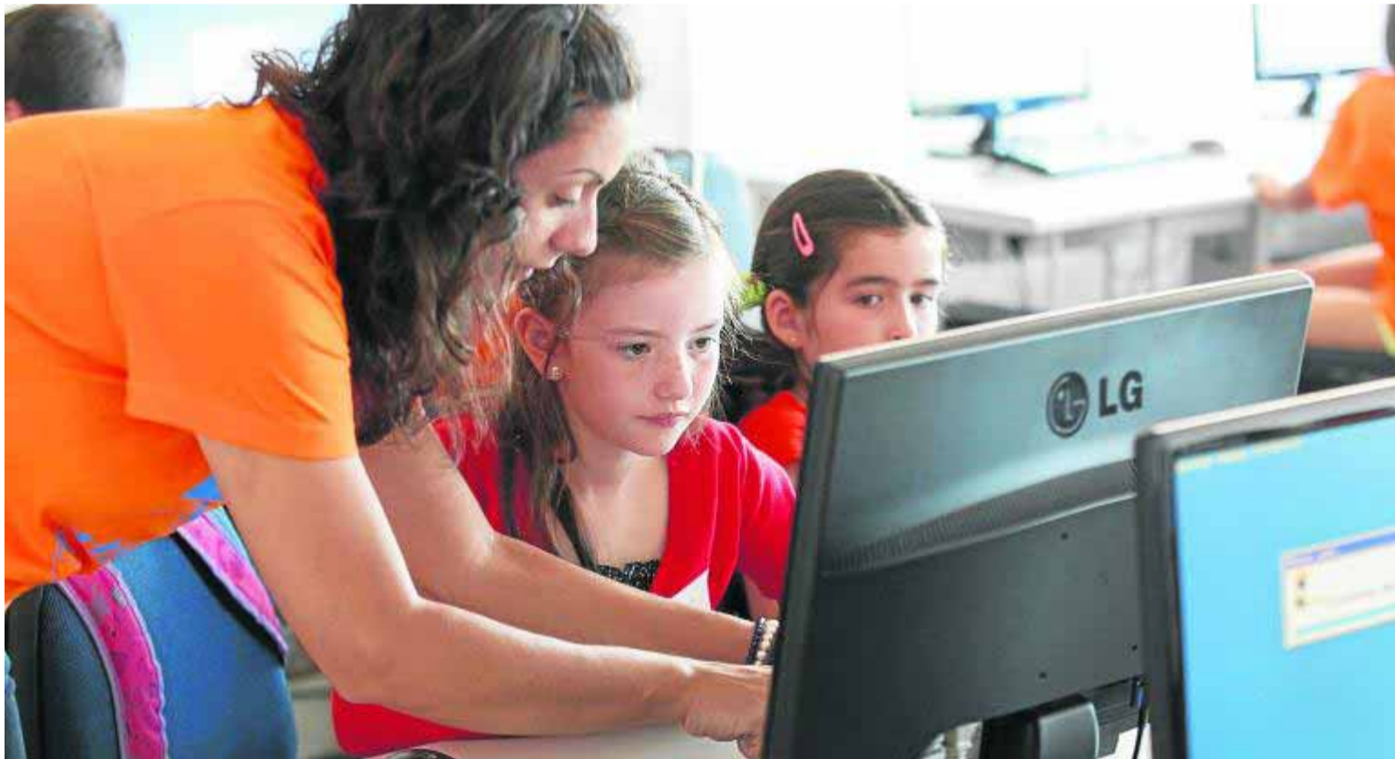
Durante dos semanas los alumnos aprenderán a crear con los ordenadores.

La primera adjudicación de plazas se conocerá el 14 de julio a través de la página web www.juntadeandalucia.es/economiainnovacionciencia-yempleo , a excepción de las plazas reservadas a titulados universitarios que se harán públicas el 2 de septiembre.