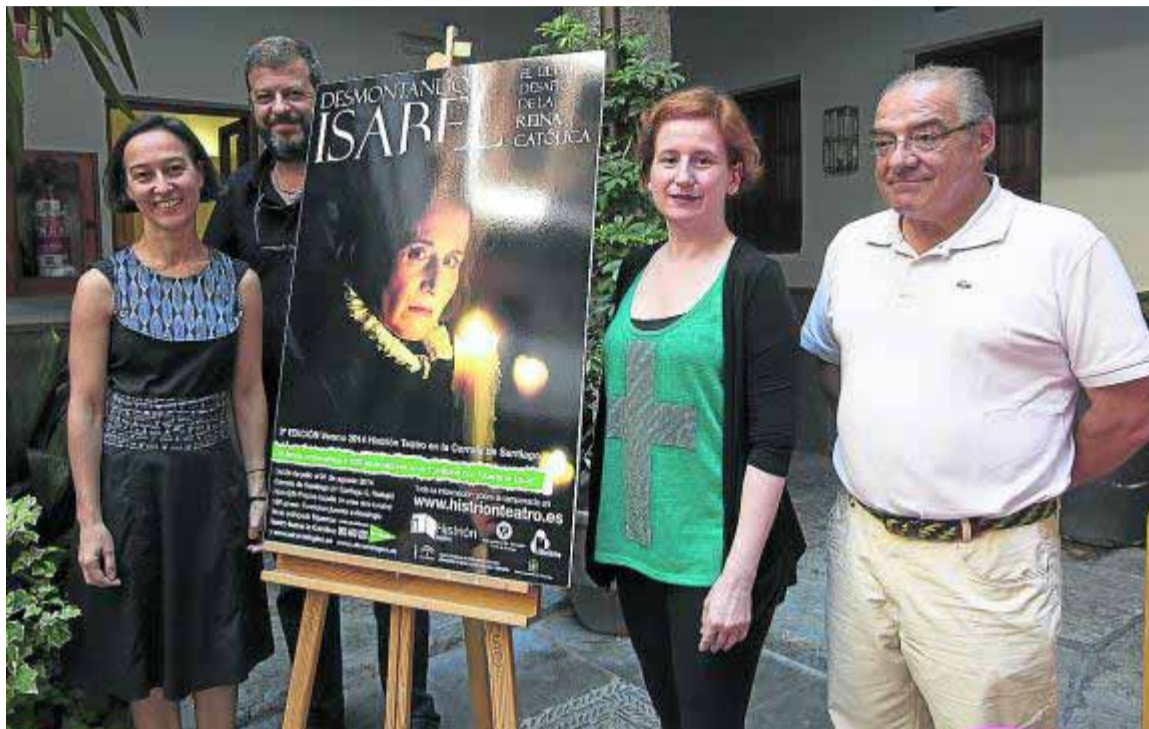
Histrión Teatro repite en la Corrala de Santiago tras el éxito del año pasado.

La productora explicó que, con esta propuesta, el público puede gozar de la belleza del lugar y, al mismo tiempo, vivir la magia de teatro a escasos centímetros de su protagonista. El aforo es de unas 80 personas, algunas de ellas ubicadas en el primer piso de la corrala, desde el que se disfruta de una visión particular y de una excelente acústica.