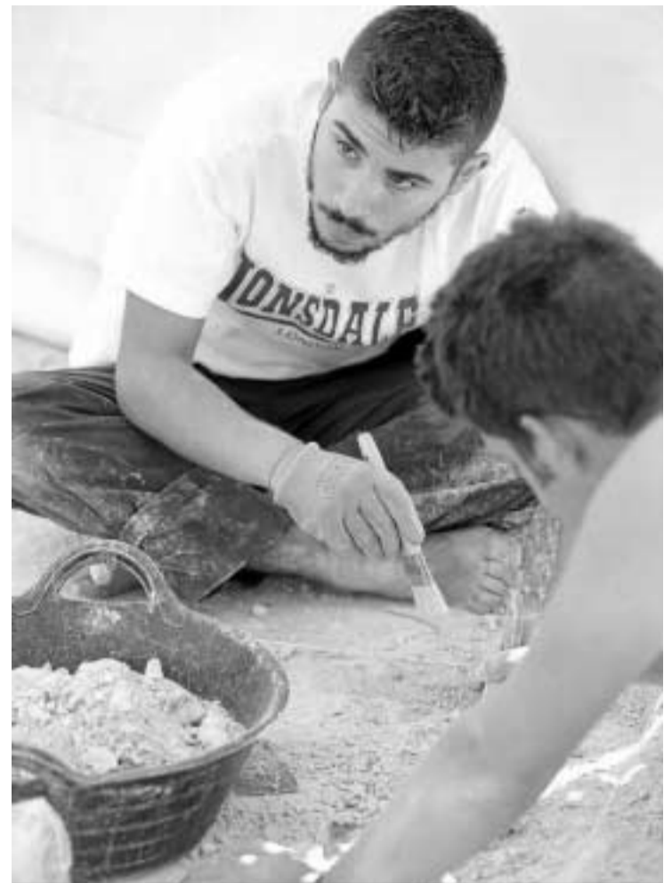
Dos jóvenes trabajando en una de las excavaciones.

El arqueólogo catalán, que lidera el equipo multidisciplinar