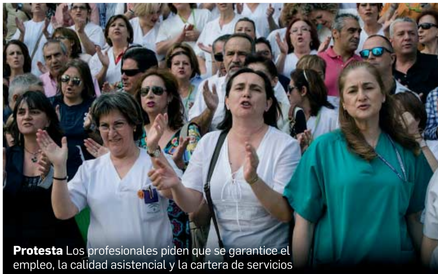
Protesta Los profesionales piden que se garantice el empleo, la calidad asistencial y la cartera de servicios

● La consejera asegura que incluso habrá que reforzar el personal