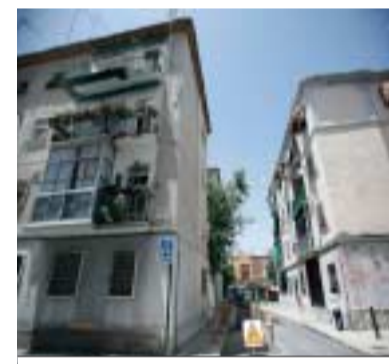
Estado del barrio.