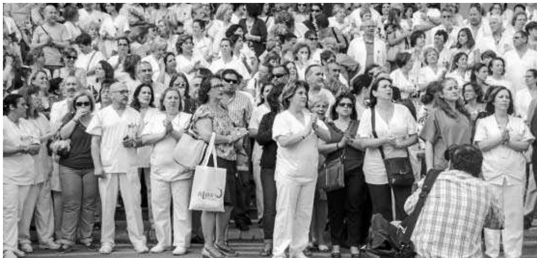
Trabajadores de los hospitales San Cecilio y Virgen de las Nieves se concentraron ayer para manifestar su disconformidad.