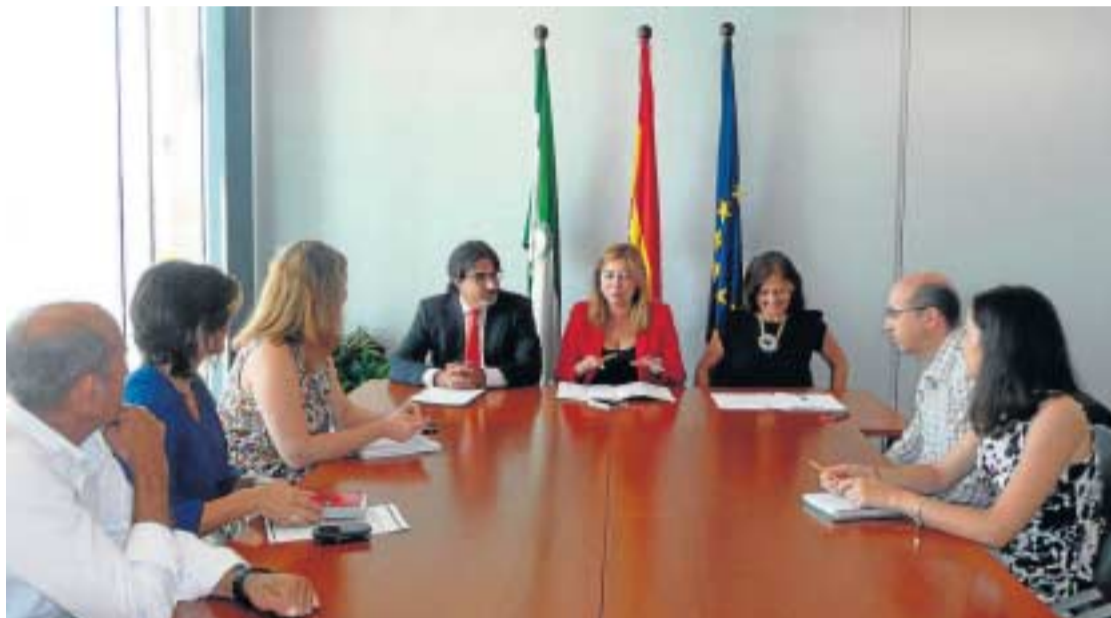
Reunión celebrada ayer en la que se dio luz verde a la celebración de los talleres.

En concreto, se trata de cinco cursos presenciales que se impartirán en los Centros de Apoyo al Desarrollo Empresarial (CADE) de cada una de las ocho provincias andaluzas. Los talle-