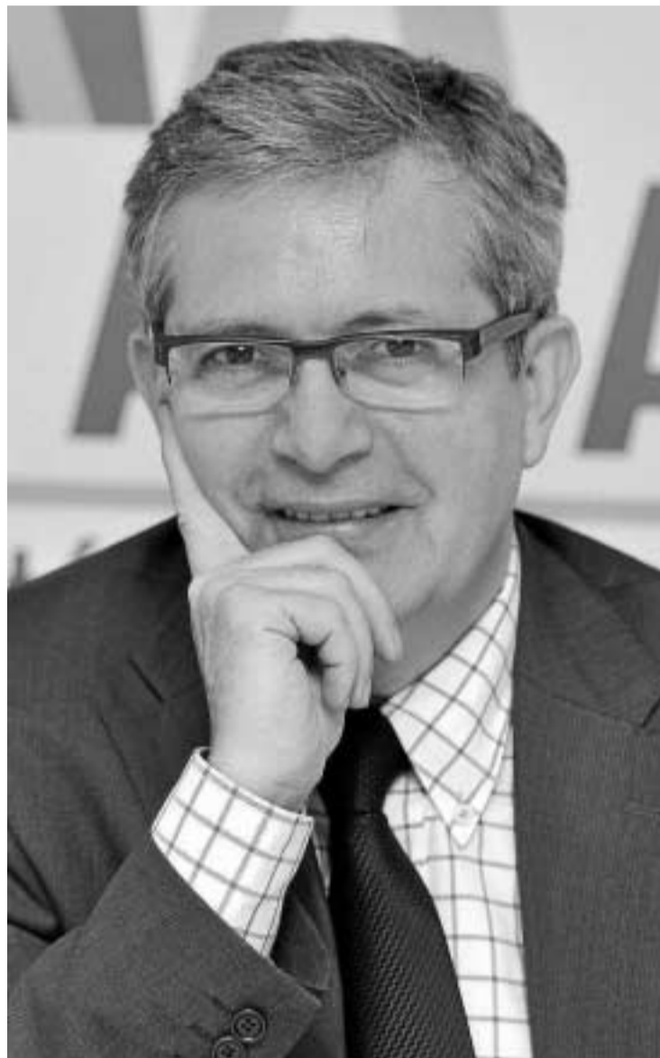
El presidente de Concapa España.

–Las familias transmiten no sólo sus dificultades por sufragar la educación que desean para sus hijos sino también sus preocupaciones porque la administración no interfiera en la formación que corresponde siempre y en primer lugar a las mismas. Necesitamos que las administraciones entiendan que su deber es colaborar con la familia en la instrucción de los hijos pero que en cuanto a la formación deben respetar el derecho de los padres como primeros educadores. El día que hayamos conseguido esto cesarán