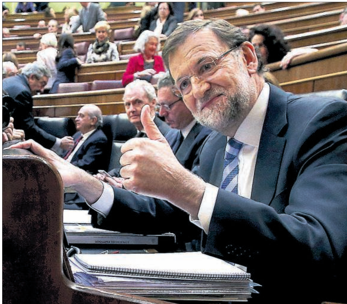
Rajoy saluda a los fotógrafos antes de comenzar la sesión de la tarde del debate.

Lo intentó en sus tres intervenciones, pero solo consiguió el silencio del presidente. Alfredo Pérez Rubalcaba reclamó la retirada del proyecto de ley del aborto sin obtener respuesta. El líder socialista denunció los recortes sociales y económicos del Gobierno y acusó a Mariano Rajoy de presentar una realidad falsa de España: "¿En qué