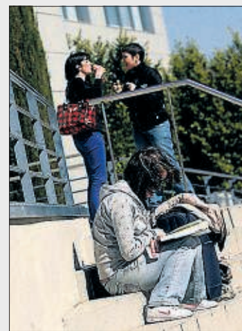
Universitarios en Castellón.

► Tipos. Los tipos de ayuda se organizan en tres: las que antes eran becas salario o compensatorias, para los alumnos con menos recursos; las de movilidad (para estudiar fuera de la comunidad autónoma de origen) y la exención del pago de matrícula.