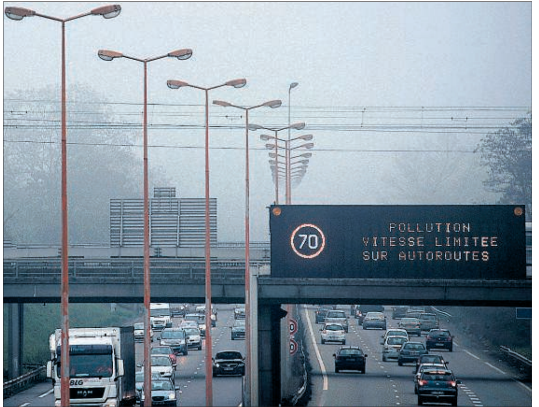
Un panel recomienda reducir la velocidad para contaminar menos en París.