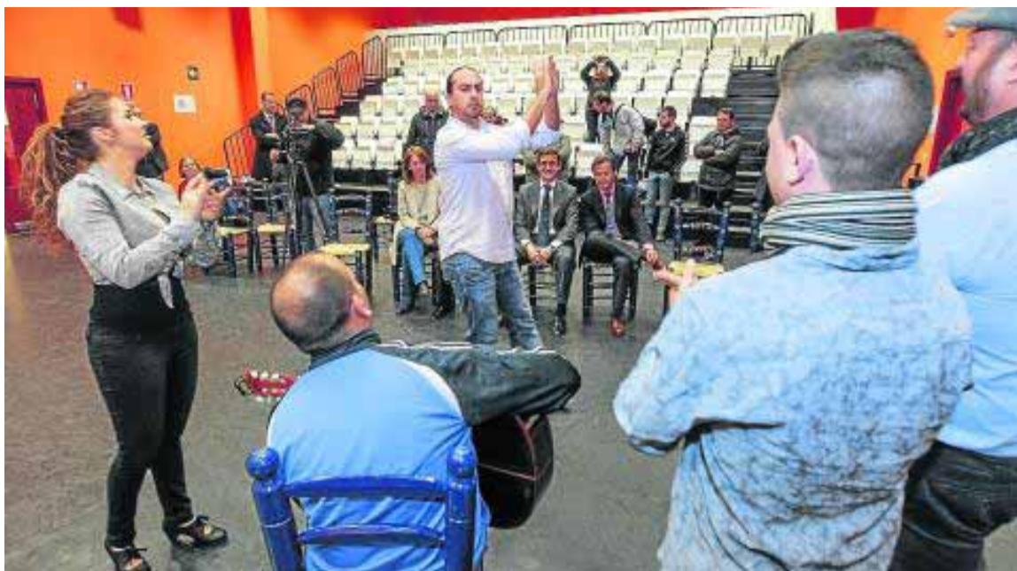
Alumnos de la Escuela de Flamenco de Granada demuestran sus cualidades ayer en su sede.