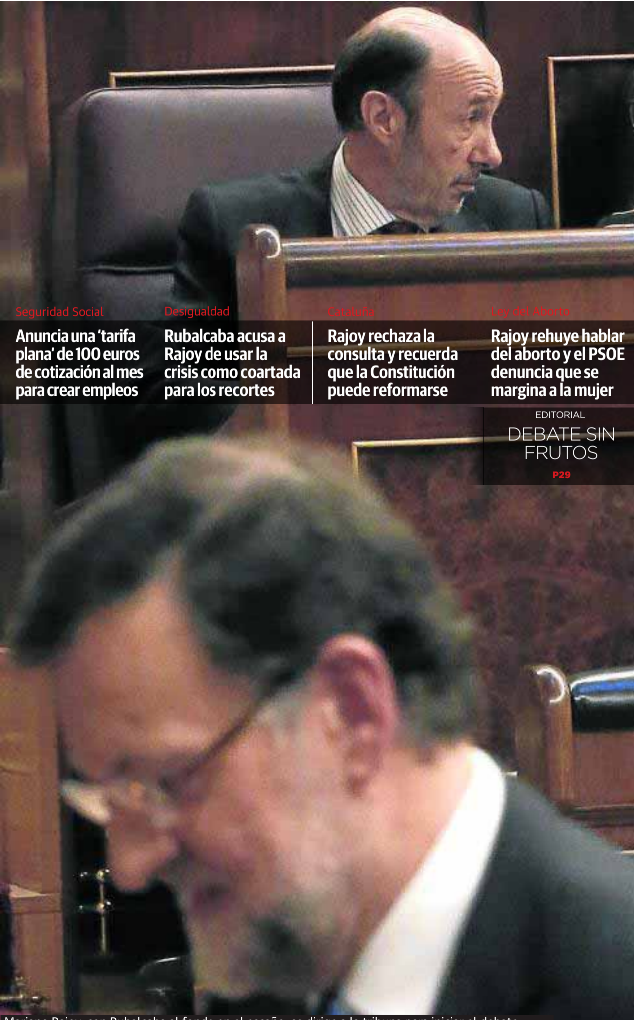
Mariano Rajoy, con Rubalcaba al fondo en el escaño, se dirige a la tribuna para iniciar el debate.

El Supremo se opone al indulto de Garzón porque no se ha arrepentido y sería injusto P33