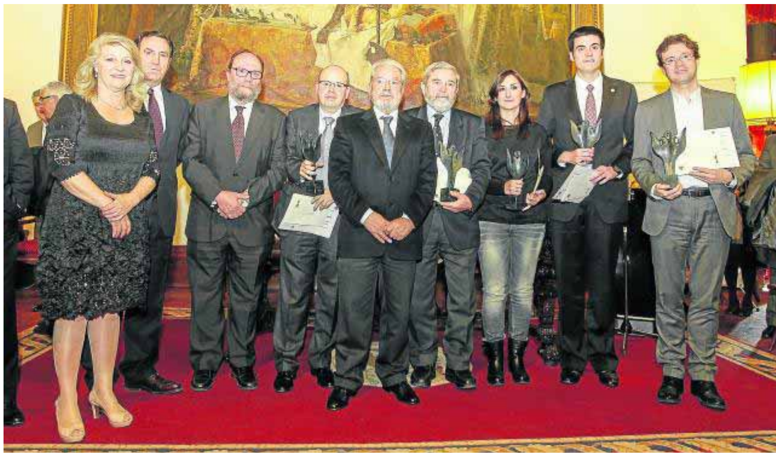
Miembros del Consejo Social de la UGR, con el rector a la cabeza (3º izda.), posan con los premiados.