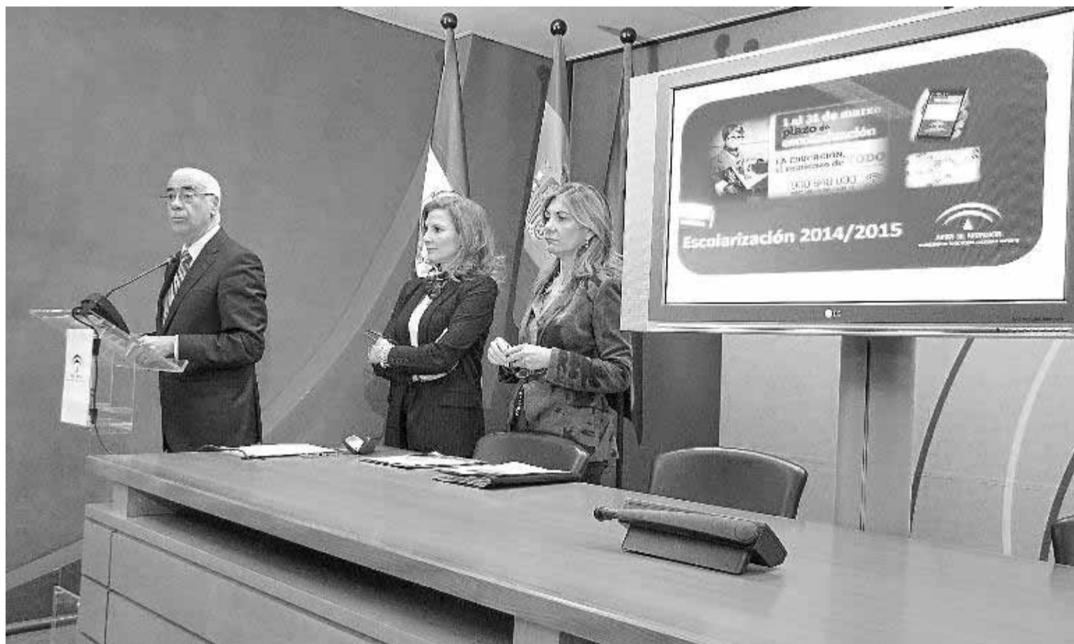
El consejero de Educación, Luciano Alonso, durante la rueda de prensa sobre el proceso de escolarización.

Las familias pueden acceder al portal de la escolarización, disponible a través de la web de la consejería, donde está recogida toda la información sobre los centros docentes, sus enseñanzas y oferta de servicios complementarios, así como la normativa que regula el proceso de escolarización y el impreso de solicitud que se podrá presentar telemáticamente o bien en los propios centros. Además, la aplicación para móviles iEscolariza permite realizar consultas de centros así como de los puntos del baremo por domicilio. Como novedad este año, a través de este dispositivo las familias recibirán notificaciones gratuitas tanto del procedimiento como de su solicitud. La consejería inicia también durante el mes de marzo la campaña 'La educación, el comienzo de todo' para informar sobre la escolarización.