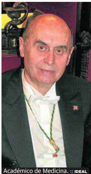
Académico de Medicina. :: IDEAL

drid, así como en París y Estados Unidos, donde pasó cinco años de su vida. También presentó su candidatura al rectorado de la Universidad de Granada en el año 1989 por el sector más conservador frente al otro aspirante Pascual Rivas, aunque no logró su propósito de convertirse en rector.