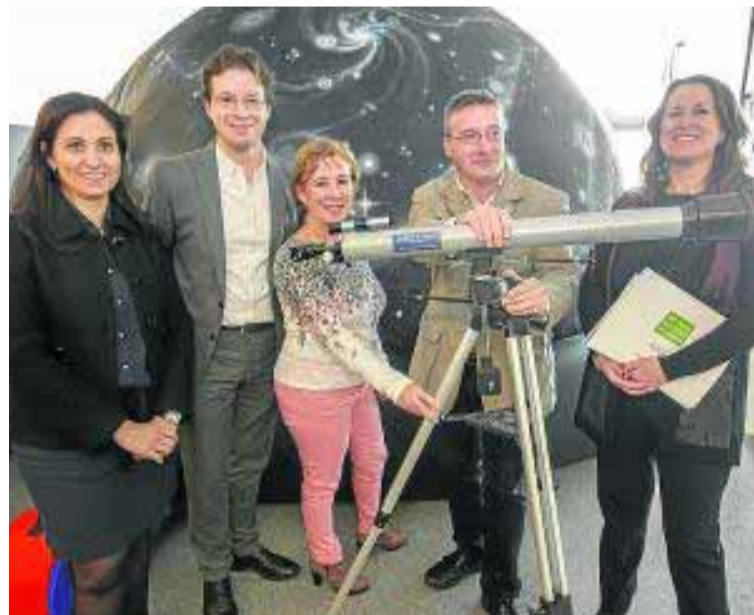
Responsables de las jornadas de astronomía y turismo.