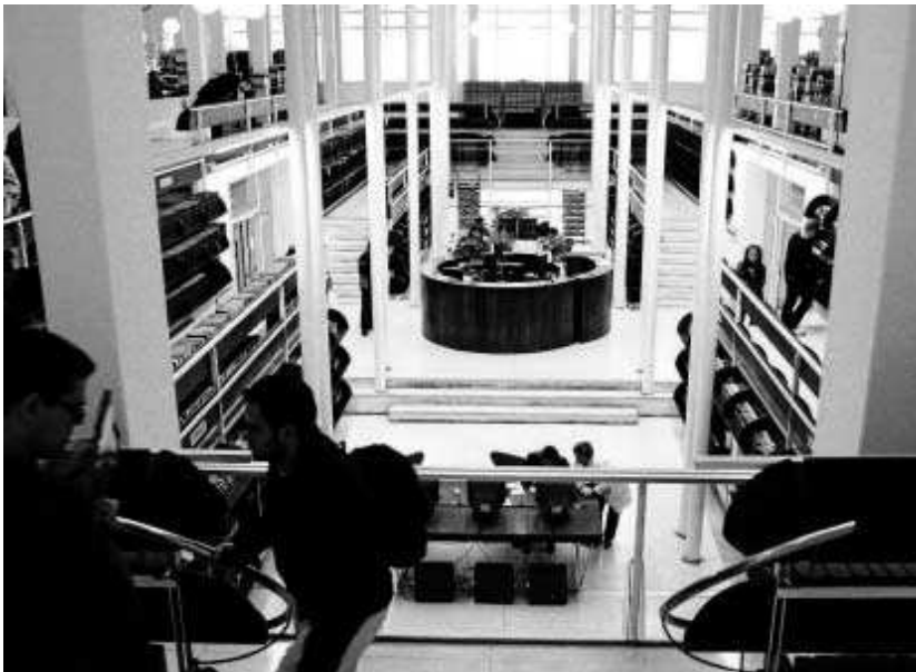
La Biblioteca Pública de Granada fue el lugar escogido para presentar las jornadas.