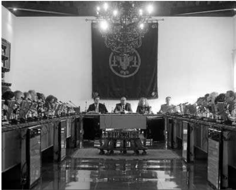
Consejo de gobierno del pasado lunes.

Como novedad, quienes cursen el grado en Biotecnología –que se impartirá en la Facultad de Ciencias– podrán completar sus estudios con una de las dos menciones que incluye el plan de estudios, Biotecnología y Salud o Biotecnología Industrial, especialidades a las que podrá optar el alumnado en el cuarto curso y que permitirá una mayor especialización, indicó la vicerrectora, que, además, destacó las salidas profesionales de la nueva titulación.