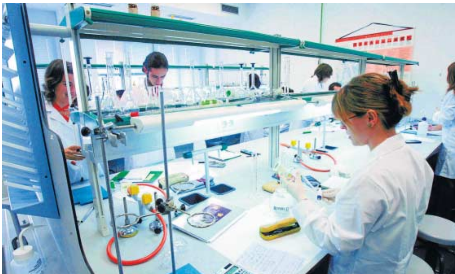
Laboratorio de Bioteconología en la Universidad Pablo de Olavide.