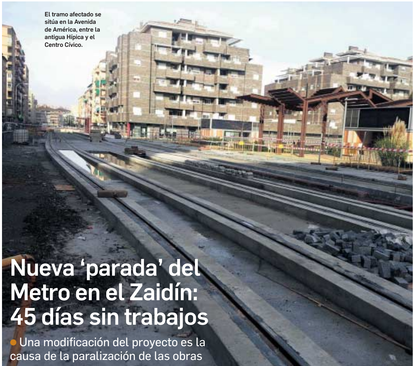
El tramo afectado se sitúa en la Avenida de América, entre la antigua Hípica y el Centro Cívico.

9 DENUNCIA DEL PARTIDO POPULAR Y DE LOS COMERCIANTES DEL DISTRITO ZAIDÍN-VERGELES