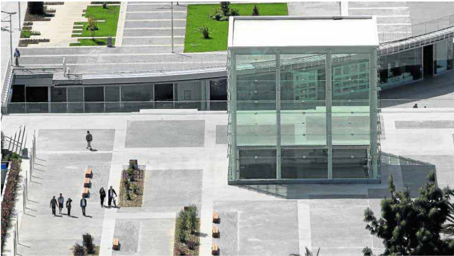
Solar del puerto de Málaga en el que se construirá la filial del Pompidou parisino.