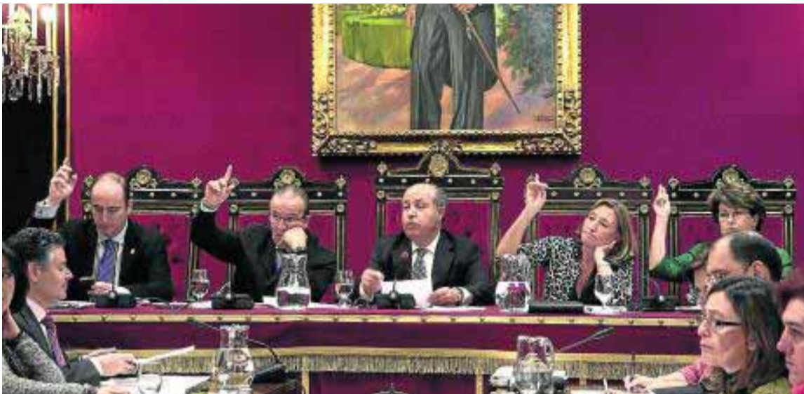
Momento de una de las votaciones del pleno celebrado ayer.