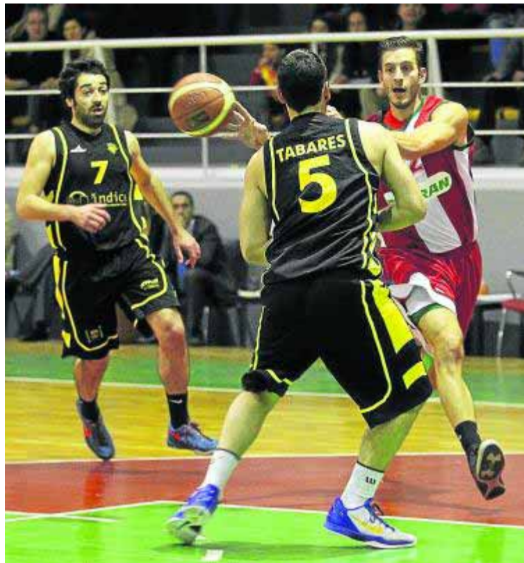
Imagen de un partido del Covirán en el pabellón Veleta.

En el apartado médico, el Covirán es sin duda el equipo más castigado. Tras perder a Miki Almazán toda la campaña por una rotura de