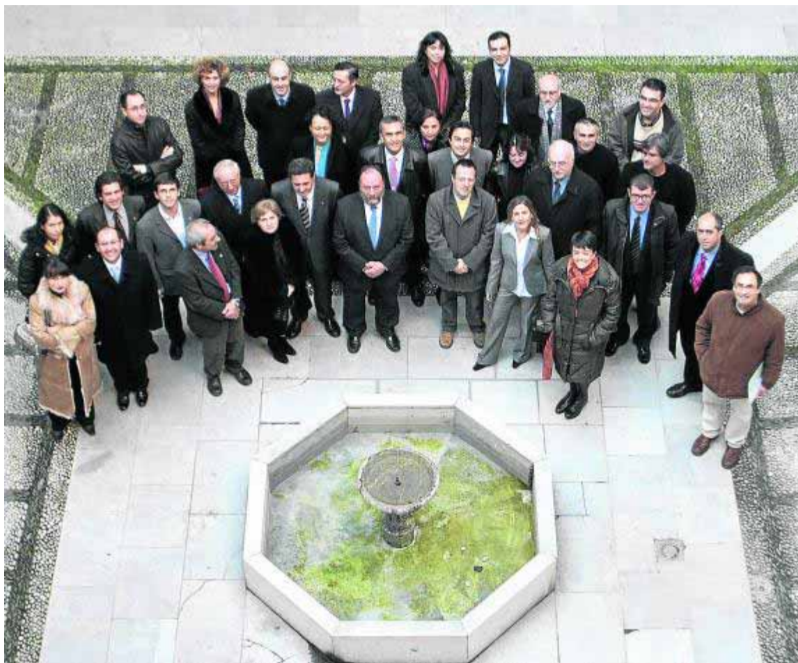
El rector, en el centro, tras una toma de posesión de funcionarios

En los últimos cinco cursos se redujo la plantilla de la Universidad granadina en 22 personas, pero si la comparativa es de los últimos tres años, que es cuando se ha dejado notar la aplicación de las normativas de la Administración debido a la crisis, la pérdida ha sido de 125 puestos. De 3.826 profesores e investigadores contratados en el curso 2010-2011 se ha pasado a 3.701. En los últimos dos cursos no se ha movido esta cifra. En el caso de personal contratado la merma en estos tres últimos cursos ha sido mayor: De 1.637