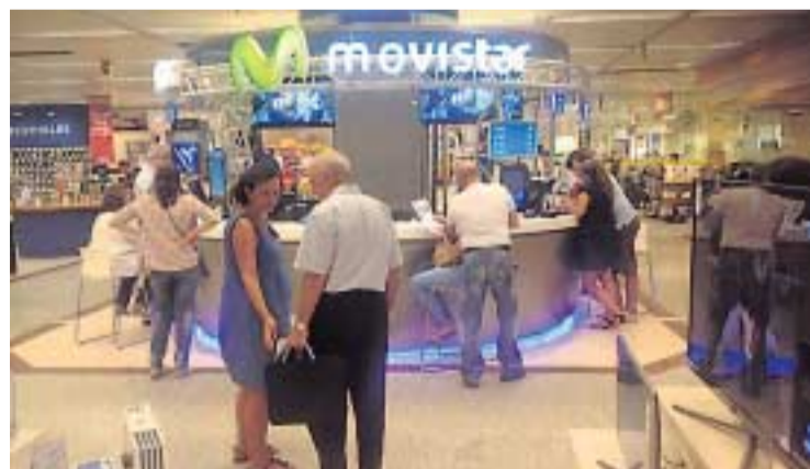
El nuevo punto de venta y asesoramiento en El Corte Inglés de San Juan.