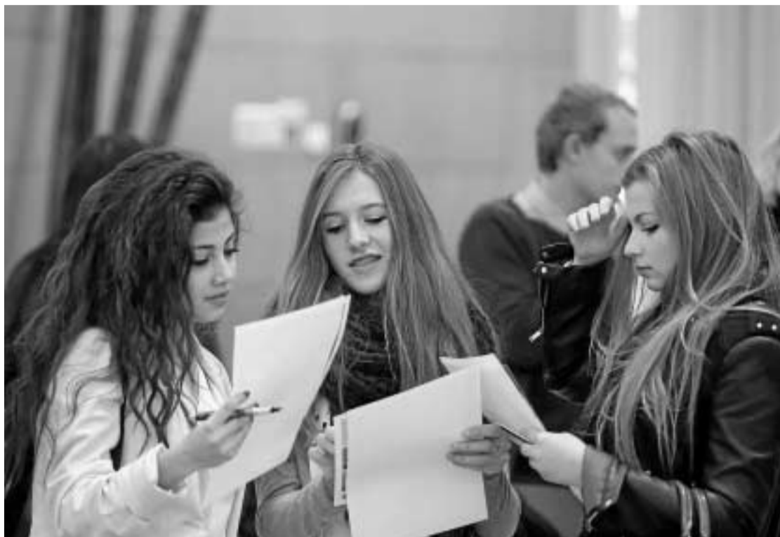
Universitarias en un salón de orientación.

Según anunció ayer la Consejería, esta promoción comenzó ayer y recorrerá en los días siguientes las ciudades de Cáceres, Salamanca, Valladolid, Burgos, León, Ciudad Real, Albacete, Cuenca, Castellón, Valencia, Alicante y Murcia, hasta visitar una quincena de universidades que