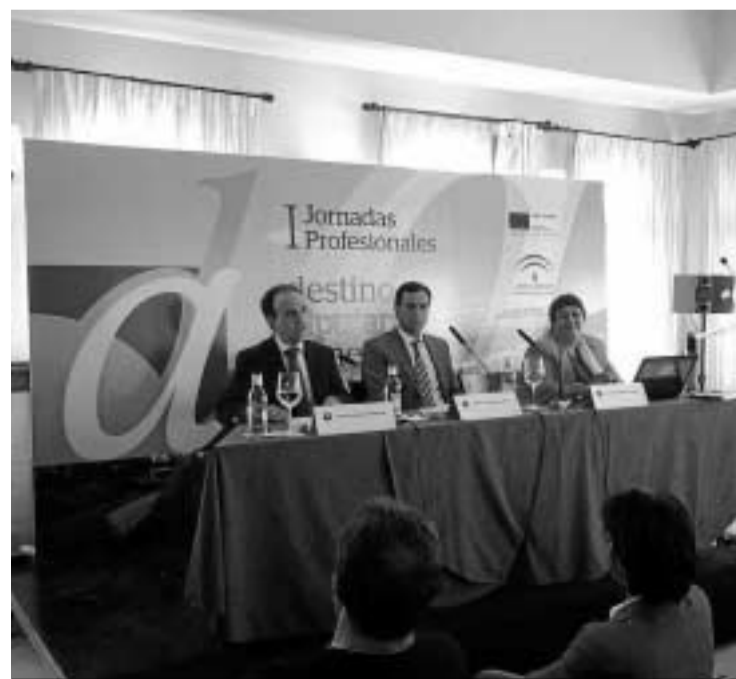
Inauguración de las jornadas.

capaz de compatibilizar de forma armónica la satisfacción del viajero, con la creación y distribución de riqueza, la generación de empleos cualificados y estables, y el respeto por el medio ambiente", dentro de un modelo de desarrollo turístico equilibrado para el interior de Andalucía. Según explicó el consejero, el turismo de interior constituye un segmento que "se halla en una clara fase de expansión" en la comunidad, al haber experimentado un crecimiento anual del 9,3%, y que tiene "un amplio mercado por conquistar, especialmente en lo que a extranjeros se refiere".