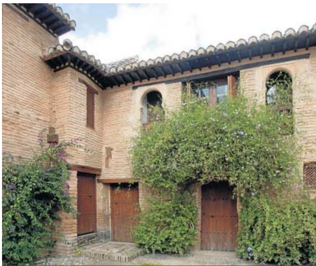
Los martes, miércoles, jueves y domingos de octubre se podrá acceder a las Casas del Partal.