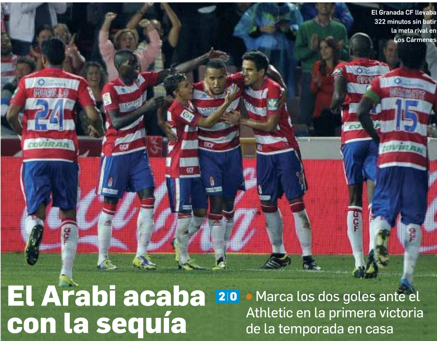
El Granada CF llevaba 322 minutos sin batir la meta rival en Los Cármenes