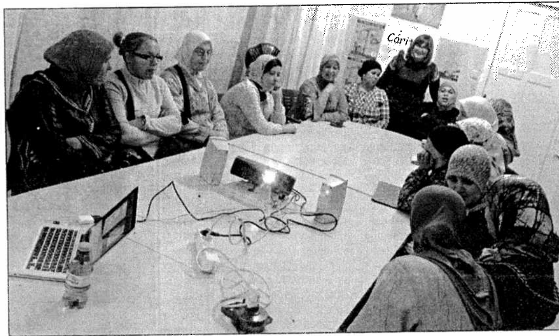
Charla en Cáritas Melilla