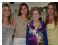
Reunión De Amigas