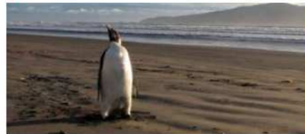
Hallan pingüino varado, a más de 1.600 km de su hábitat