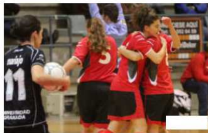
Las jugadoras del Santa Rosa celebran un gol.

P. S. Victoria del Santa Rosa frente al Universidad de Granada (5-2) que permite estrenar el año como terminó 2012, sumando los tres puntos frente a un rival directo por la permanencia. Las alcoyanas consiguen así distanciarse de la zona de peligro y, además, se sitúan como el tercer equipo más realizador del grupo. El aspecto defensivo, con 30 goles en contra, sigue siendo un importante lastre que implica quedarse estancado en la clasificación.