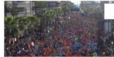
Mitja Marató de Santa Pola 2013

Diari de Girona | Diario de Ibiza | Diario de Mallorca | Empordà | Faro de Vigo | La Opinión A Coruña | La Opinión de Granada | La Opinión de Málaga | La Opinión de Murcia | La Opinión de Tenerife | La Opinión de Zamora | La Provincia | La Nueva España | Levante-EMV | Mallorca Zeitung | Regió 7 | Superdeporte | The Adelaide Review | 97.7 La Radio | Blog Mis-Recetas | Euroresidentes | Lotería de Navidad | Oscars | Premios Goya