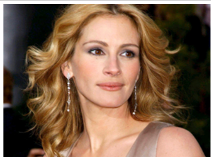
Les jolies femmes ont la vie plus facile? Pas dans le cadre d'un procès en légitime défense

Deux scénarii ont été proposés aux participants. Dans le premier, la femme qui subit un procès est "attirante". Elle a des lèvres pulpeuses, des traits doux et harmonieux, des cheveux blonds et raides, en plus d'être mince et élégante. Dans l'autre, elle est "peu attrayante" avec ses lèvres minces, ses traits peu harmonieux et sévères, ses cheveux foncés et en bataille, et son apparence, ni élégante ni mince.