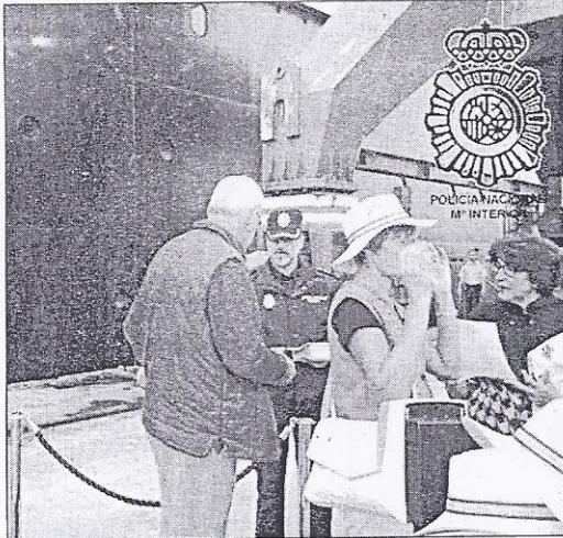
La policía informó a los turistas con el "Plan Turismo Seguro"