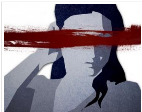
Al presentar como atractiva a la acusada de matar a su maltratador, los participantes le atribuyeron mayor responsabilidad en los hechos.

La belleza de una acusada puede influir injustamente en la percepción de su culpabilidad