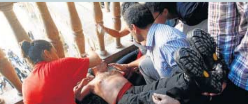
Algunos manifestantes también sufrieron lipotimias.