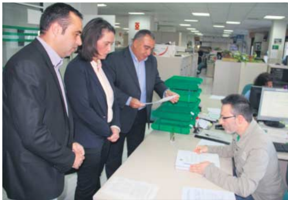
Responsables del Consorcio Puerto de la Ragua, ayer en el registro de Medio Ambiente de la Junta.

En el anteproyecto se recoge una clara intención de 'reciclar' espacios y pistas ya existentes además de procurar las nuevas dotaciones con el menor impacto posible. Así, las bases del modelo son contribuir a la permanencia de un legado tras el evento (la postuniversiada que llaman); no incrementar el número ni la dimensión de las edificaciones ni instalaciones actuales sino mejorar sus infraestructuras así como posibilitar la homologación de las pistas; propiciar el desestacionalización de la demanda e incrementar la eficiencia de la estación.