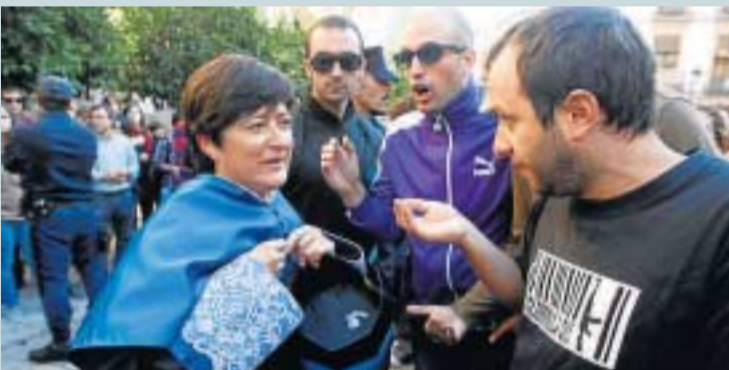
Fueron bastantes los doctores que intentaron dialogar.