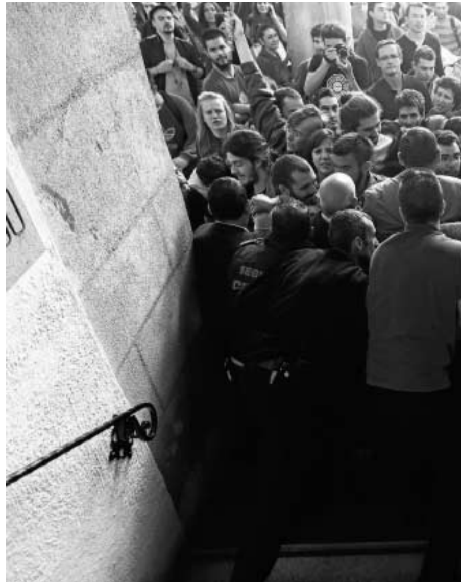
En el acceso al Salón Rojo fue donde se vivieron los momentos más violentos.