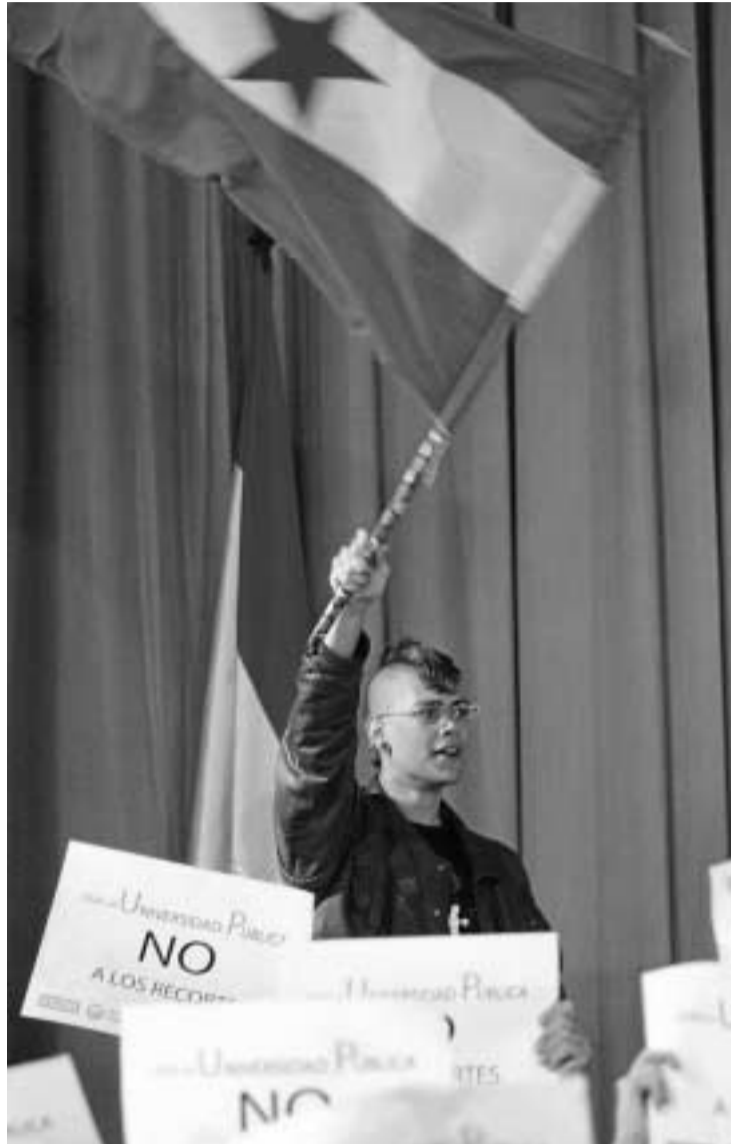
Los manifestantes portaron carteles de 'No a los recortes'.

El cortejo, presidido por el rector como es tradicional, tuvo que ser protegido por las fuerzas del orden para poder realizar la salida procesional, que finalmente se inició con retraso.