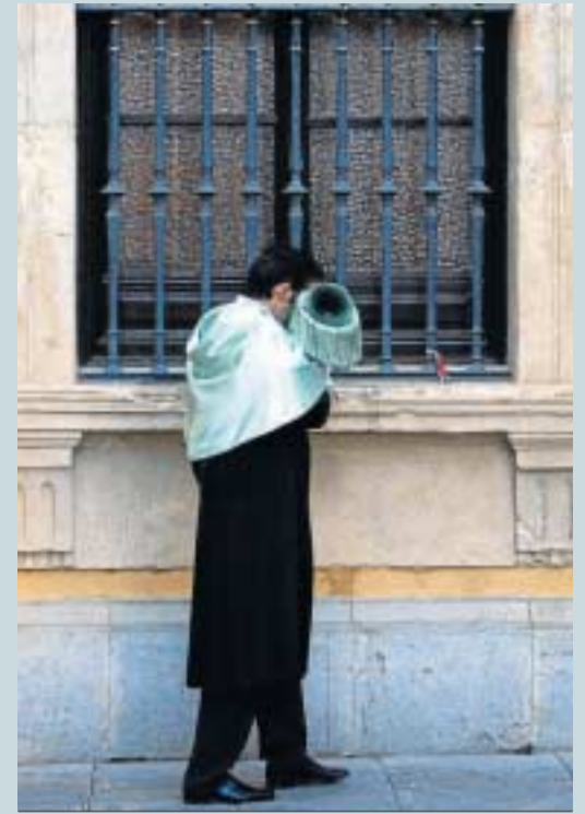
Los nuevos doctores recibieron su birrete pero entre mucha tensión.