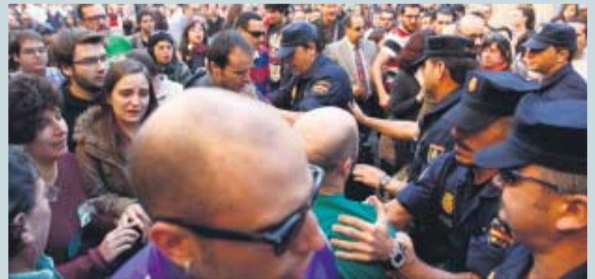
Intervención de la Policía Nacional.