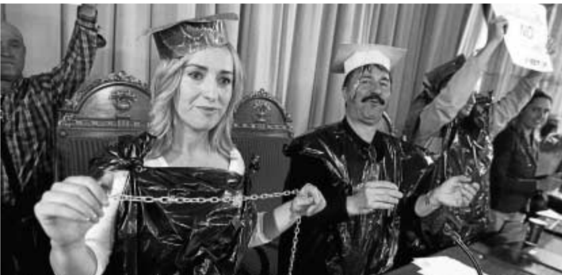
Los participantes en el encierro se encadenaron hasta que el Rectorado se abrió a los manifestantes.