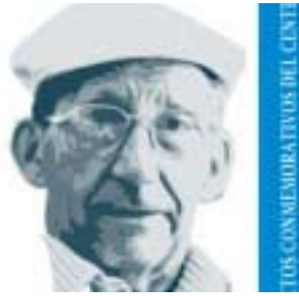
TOS CONMEMORATIVOS DEL CENTE

● Inauguración de la exposición José Fernández Castro en su entorno íntimo en el Palacio de los Condes de Gabia a partir de las 19:30 horas.