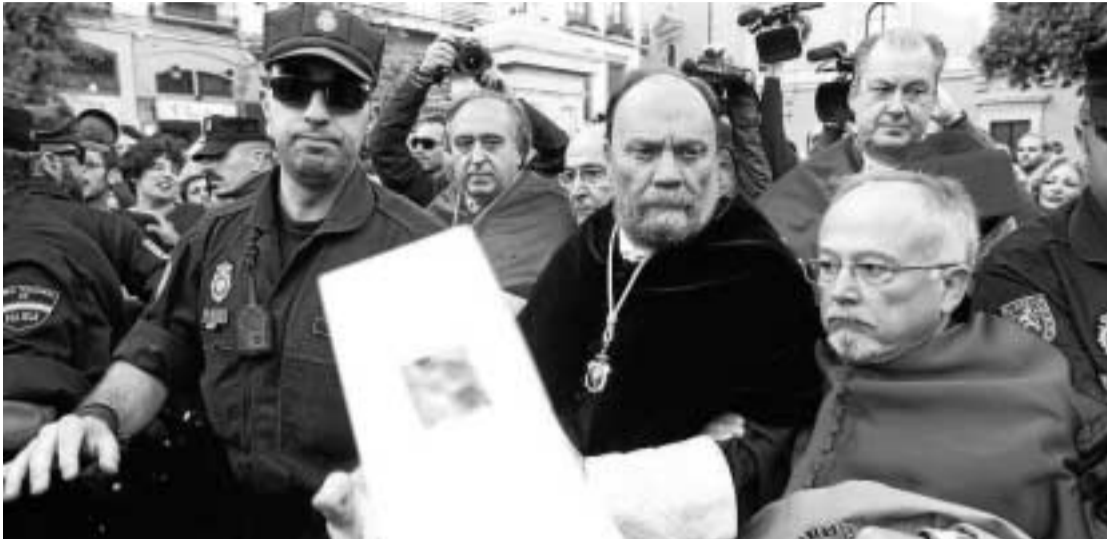
La comitiva oficial salió entre empujones de la Facultad de Derecho.

ENSEÑANZA SUPERIOR Estudiantes, profesores y PAS unidos contra el decreto