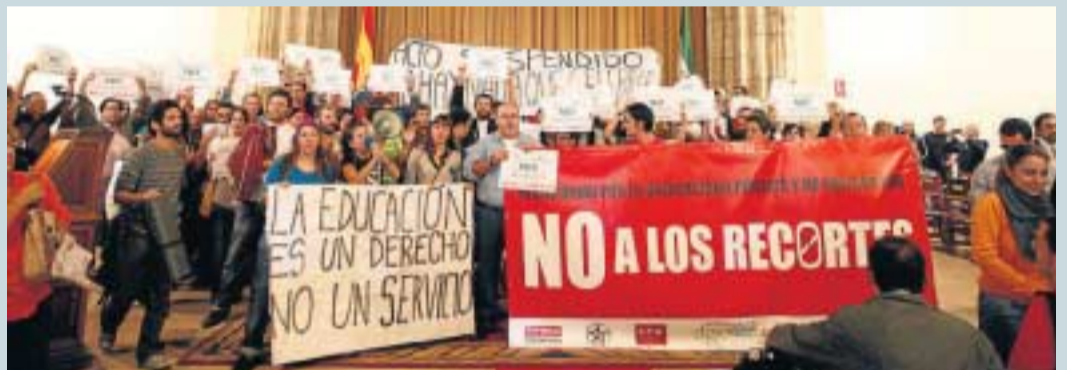
El Crucero se convirtió en escenario de un acto muy distinto del previsto.