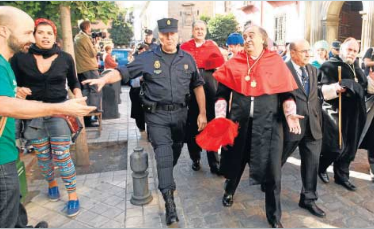
La comitiva académica asistía resignada a las protestas de profesorado, PAS y docentes.

ENSEÑANZA SUPERIOR La Plataforma torpedea el programa oficial de inauguración