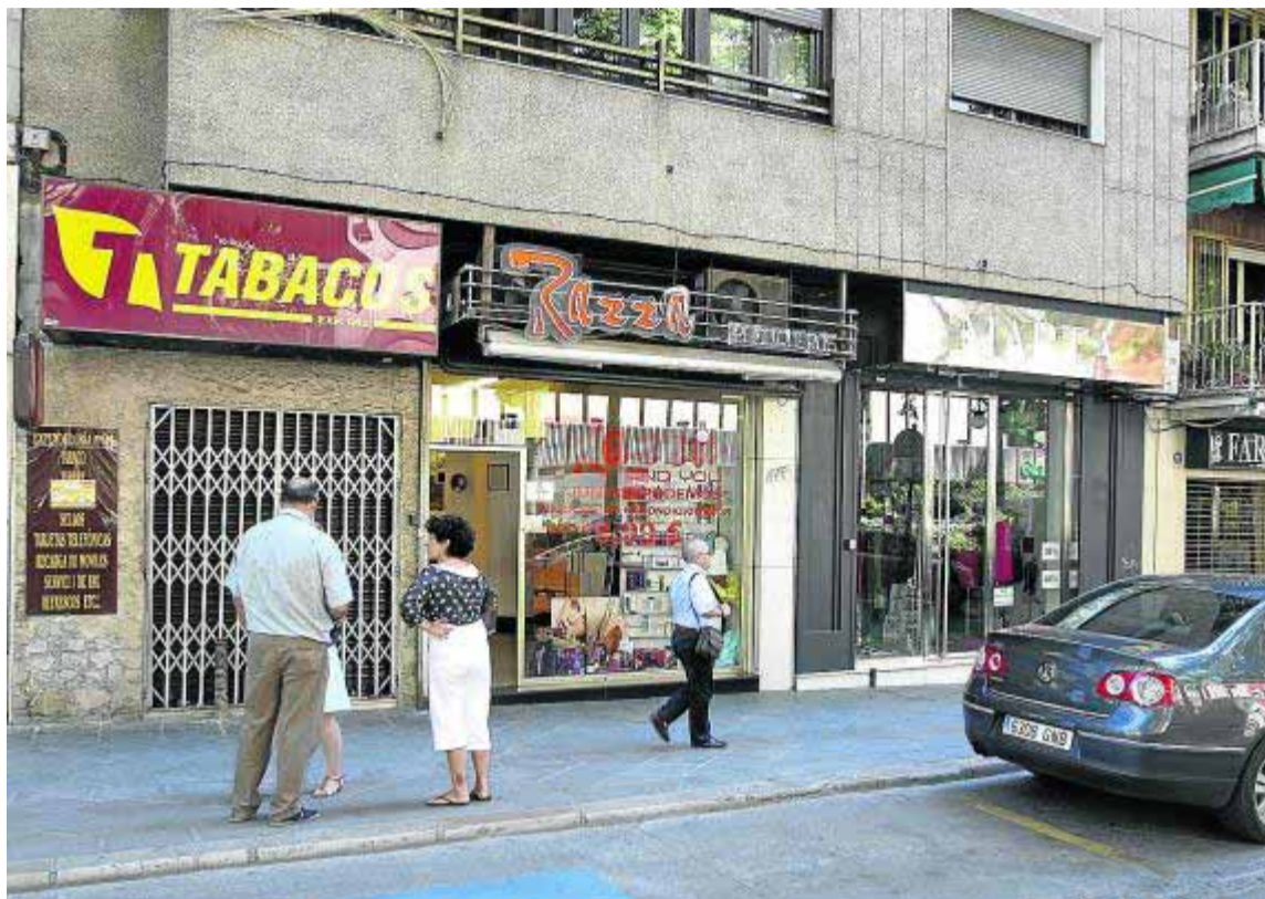
Vista de los tres establecimientos afectados.

Los ladrones que practican esta modalidad de saqueo suelen preferir los polígonos industriales y, en general, los lugares aislados para perpetrar los robos. Tiene lógica. Agujerear muros no es una actividad que pase desapercibida. Así que la noche y la lejanía de los sitios habitados suelen ser sus mejores aliados. Por eso es raro lo que ocurrió, presumiblemente, la madrugada de ayer domingo en la Carrera de la Virgen, en el centro de la ciudad. Tres comercios colindantes amanecieron