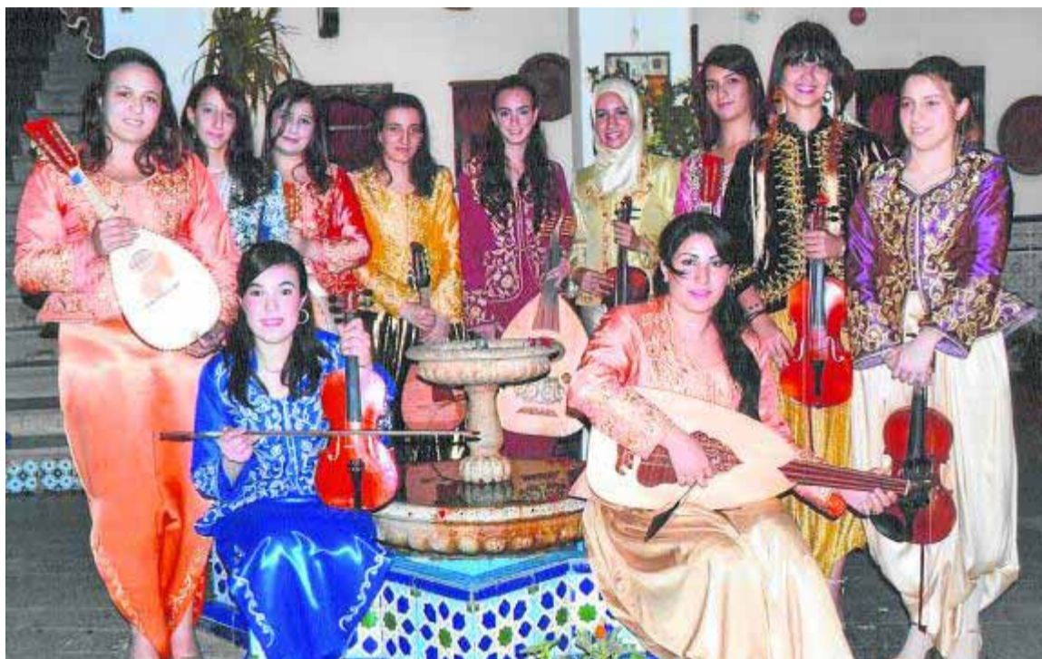
Algunas de las cantantes e intérpretes musicales argelinas de Dar-el-Gharnati.

Estos andalusíes argelinos son los conservadores de unas músicas que en primera instancia mantuvieron