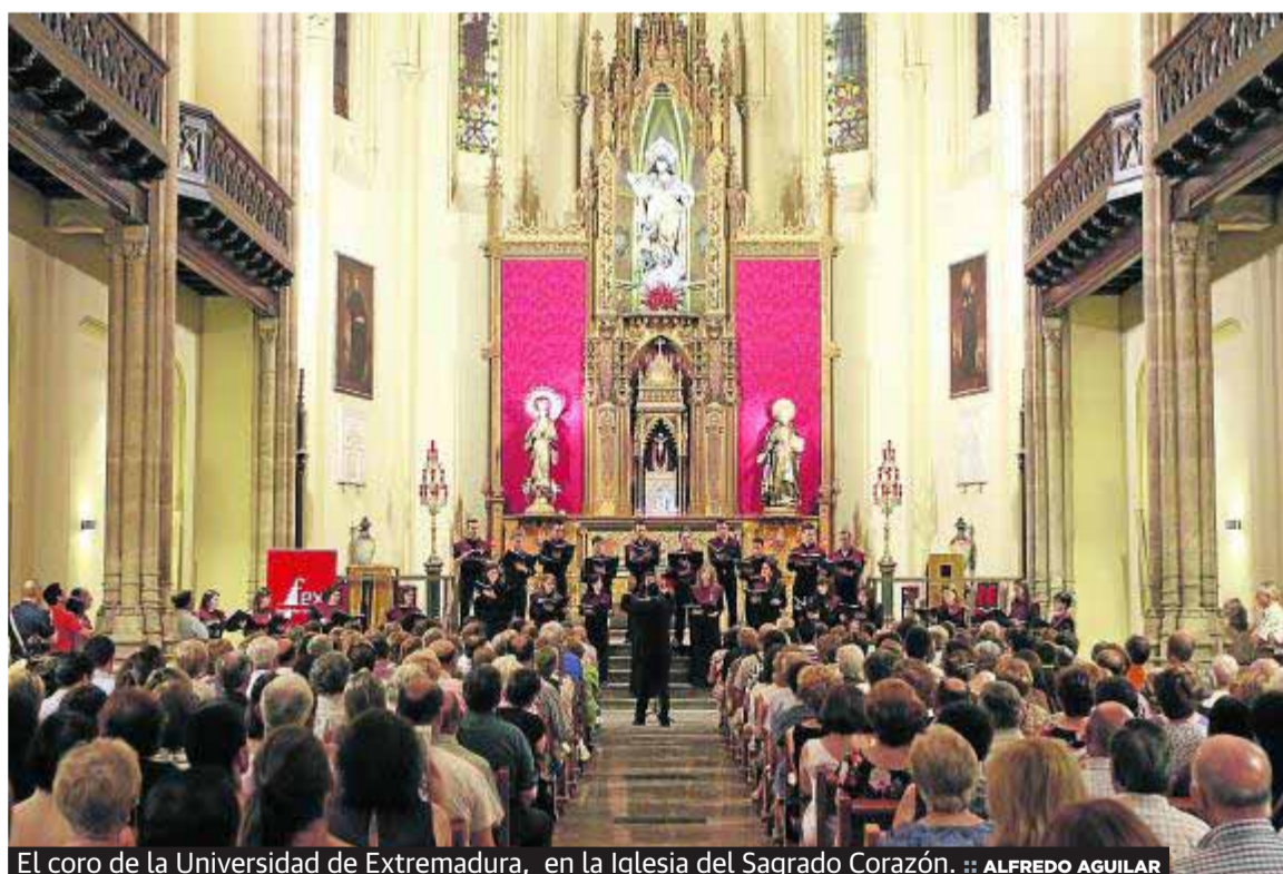
El coro de la Universidad de Extremadura, en la Iglesia del Sagrado Corazón.

► Orquesta Joven del Bicentenario (Fex). Plaza de las Pasiegas. 22.00 horas. Estudiantes de los conservatorios gaditanos.