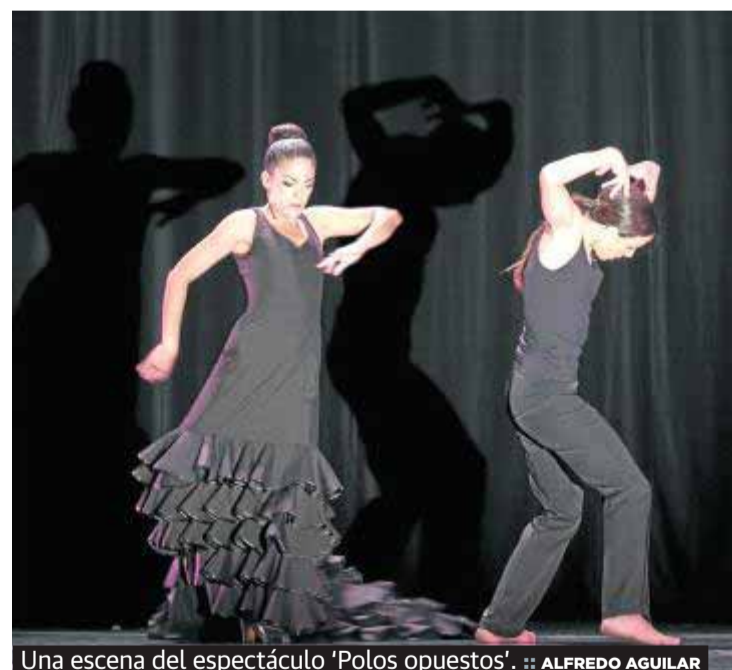
Una escena del espectáculo 'Polos opuestos'.

Los coros Manuel de Falla de la UGR y el de la Universidad de Extremadura unieron sus voces con sus respectivas actuaciones en una abarrotada Iglesia del Sagrado Corazón, donde ofrecieron repertorios vocales, muchos de ellos de la música polifónica renacentista. La formación granadino tuvo como director invitado a Pablo Guerrero Elorza.