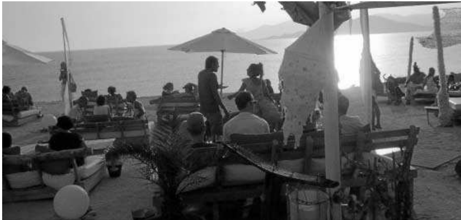
En su viaje, los ganadores del concurso disfrutarán de una casa de ensueño, un barco a su disposición, chófer y chef personal.