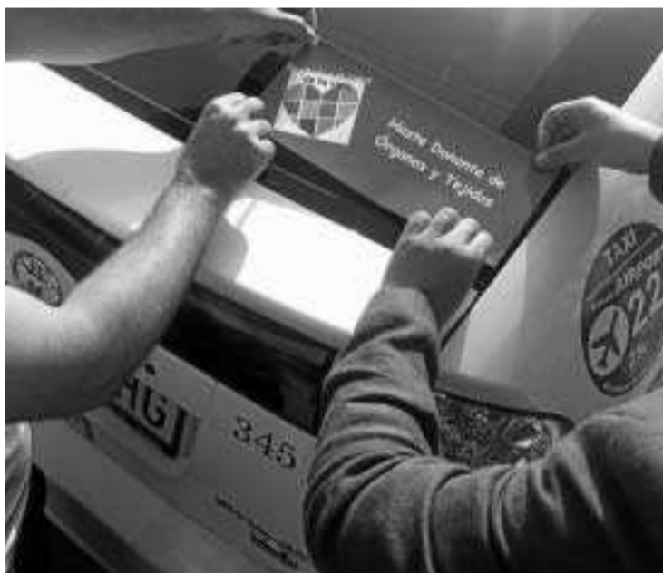
Los vehículos lucirán una pegatina con un mensaje a favor de la donación.

la bandera de la donación y extender el mensaje de que donar órganos es dar vida, por lo que se ponen al servicio de una buena causa”. “Todos los taxis se convierten en corresponsables de seguir haciendo de Granada un ejemplo y referente en generosidad y solidaridad. Serán escaparates móviles para lanzar el mensaje de la donación, que hará que muchos ciudadanos tengan esperanza”, matizó Almagro.