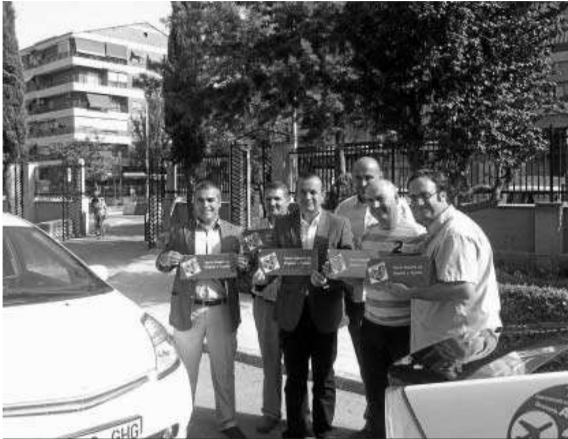
La junta directiva de la Gremial del Taxi de Granada, con el delegado de Salud y el coordinador de trasplantes.