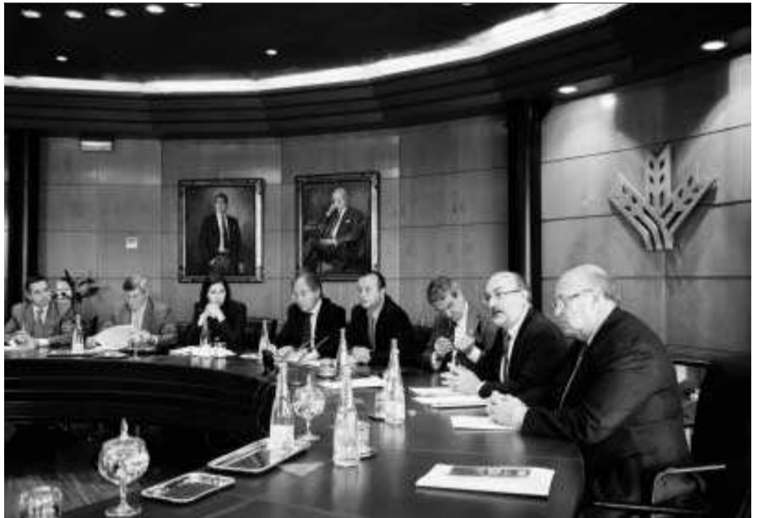
El jurado de la VIII edición del premio Ciencias de la Salud de la Fundación Caja Rural de Granada. J. OCHANDO