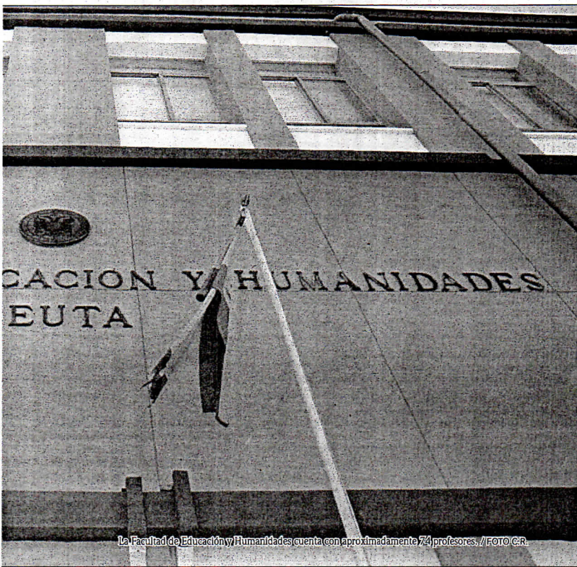
La Facultad de Educación y Humanidades cuenta con aproximadamente 74 profesores.