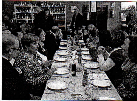
Digmun agradeció la colaboración de ciudadanos y el restaurante Rigoletto.