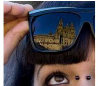
Una joven con unas gafas de sol en Se BALLESTEROS

Desde el Colegio de Ópticos-Optometristas de Galicia se recuerda que cada vez es más necesario utilizar gafas de sol, sobre todo al amanecer y al atardecer del día. «A esas horas el sol está a nuestra altura, provocando que su radiación sea más directa; además las pupilas se dilatan por la falta de luz», explican los profesionales gallegos.